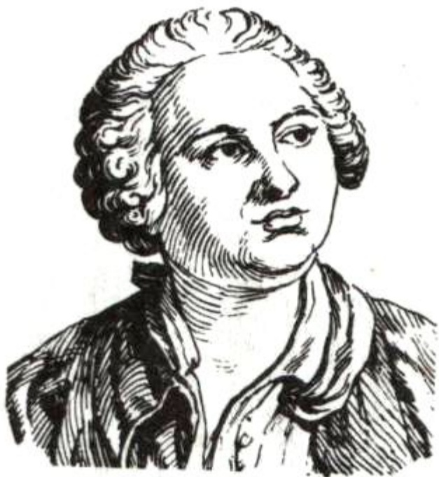
Михаил Васильевич Ломоносов (1711—1765)

«Пусть кто-нибудь попробует вычеркнуть из математики степени, и он увидит, что без них далеко не уедешь».