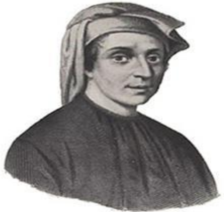
Леонардо Фибоначчи (12-13 век)