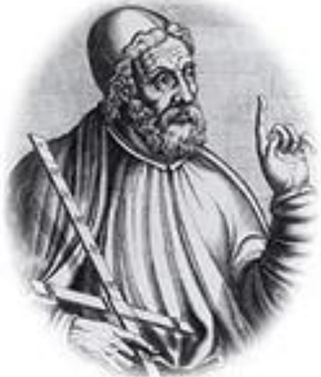
ЭВКЛИД (около 365-около 300 г. до н.э.) древнегреческий математик