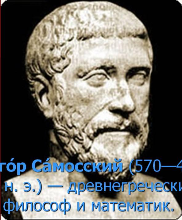
Пифагóр Сáмосский (570—490 гг. до н. э.) — древнегреческий философ и математик.