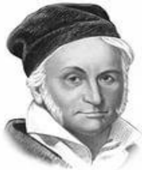
ГАУСС Карл Фридрих 1777-1855