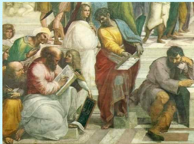
Боэций (слева) на фреске Рафаэля «Афинская школа»