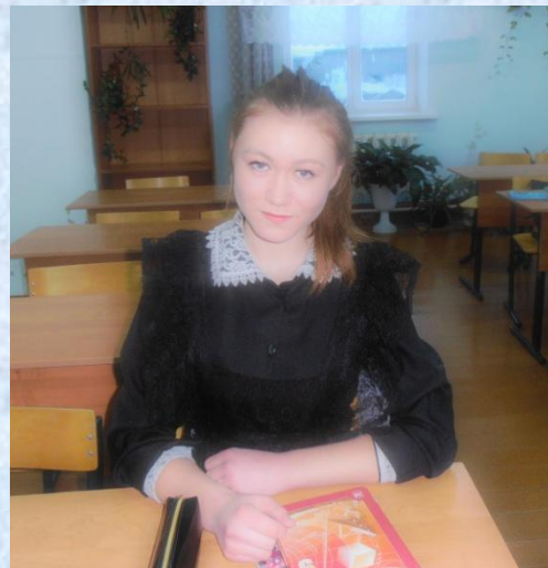
Автор – Ипатьева Екатерина, 9 класс