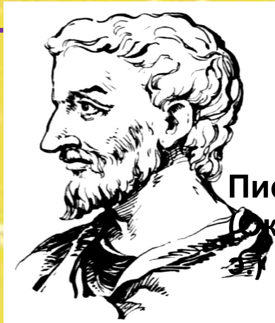
Пифагор Самосский ок.580 – ок.500г.до н.

Однажды, гуляя, он подошел к реке. Река тотчас вышла из берегов и закричала(!) « Да здравст