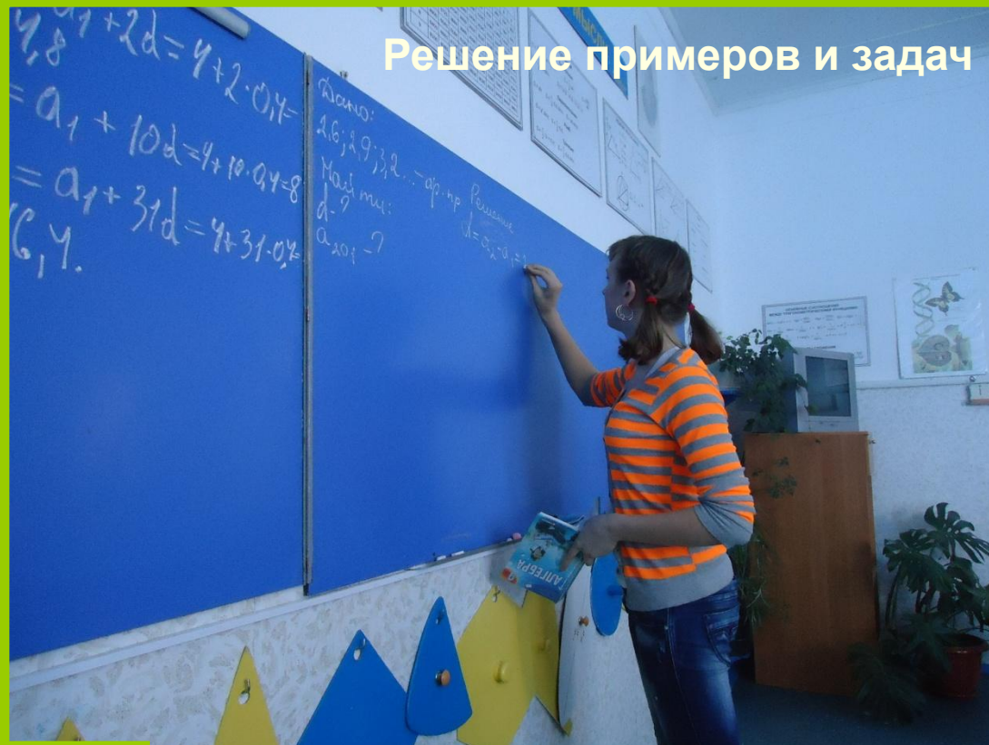
Решение примеров и задач