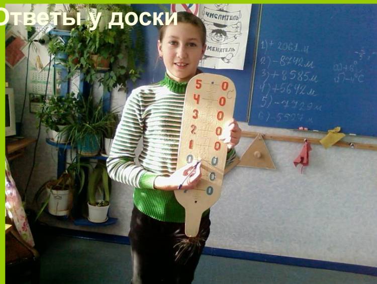
Ответы у доски