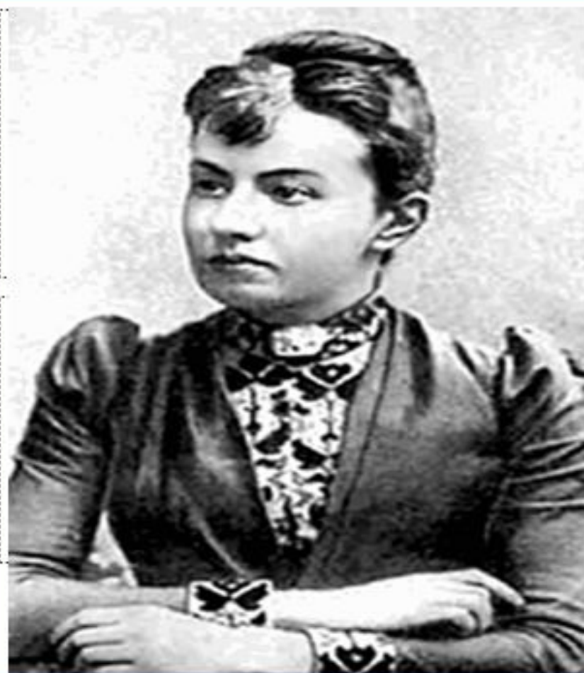
С. В. Ковалевская (1850г. - 1891г.)

«У математиков существует свой язык- это ФОРМУЛЫ»