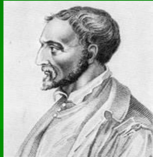
Кардано (1501-1576 г.)