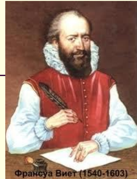
Франсуа Виет (1540-1603)