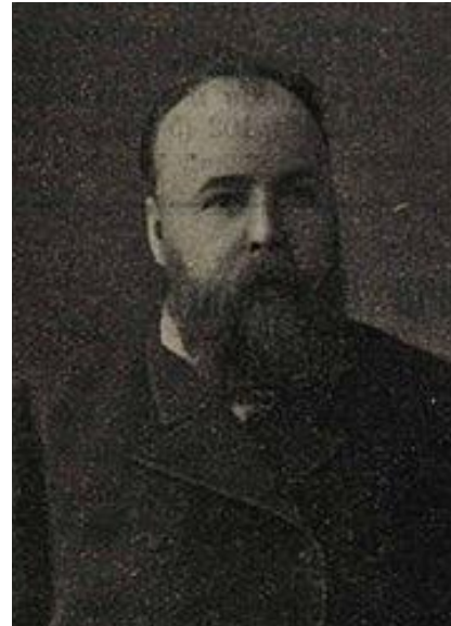
Платон Сергеевич Порецкий