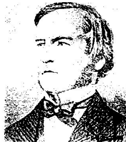
Дж. Буль (1815–1864)