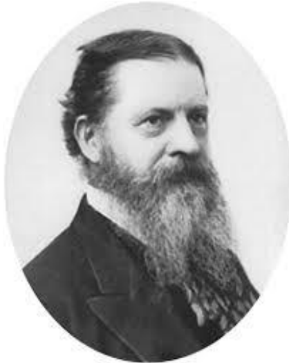
Чарлз Сандерс Пирс