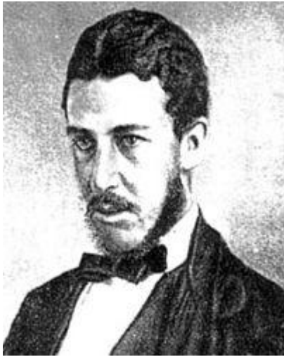
Уильям Стенли Джевонс