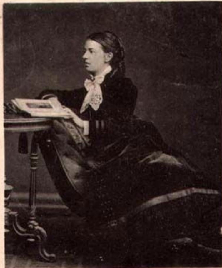
София Васильевна Ковалевская, урожд. Корвинь-Круковская, 1850—1891.

Доктор философии Геттингенского университета, проф. математики Стокгольмского университета.