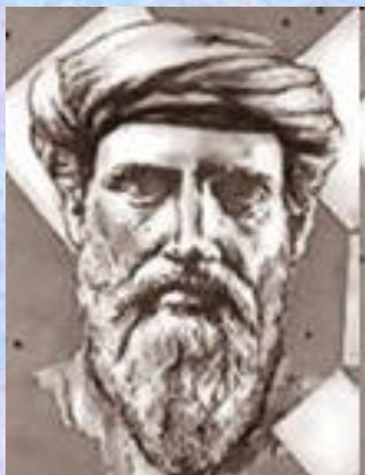
ал - Каши