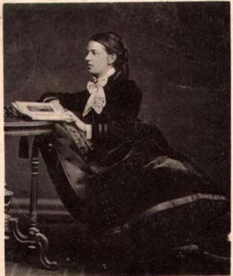
София Васильевна Ковалевская, урожд. Корвинь-Круковская, 1850—1891.

Доктор философии Геттингенского университета, проф. математики Стокгольмского университета.