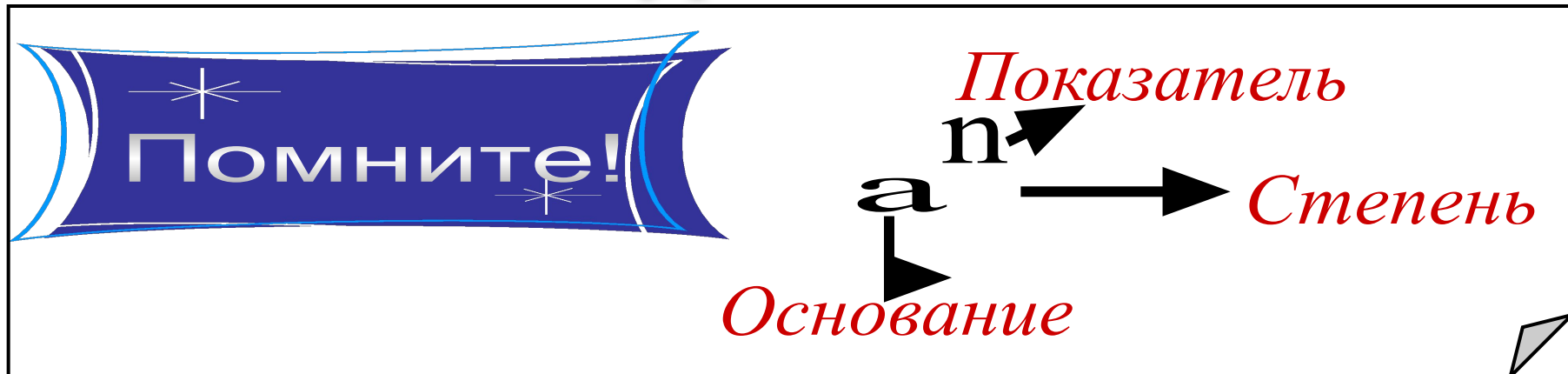
Таблица основных степеней