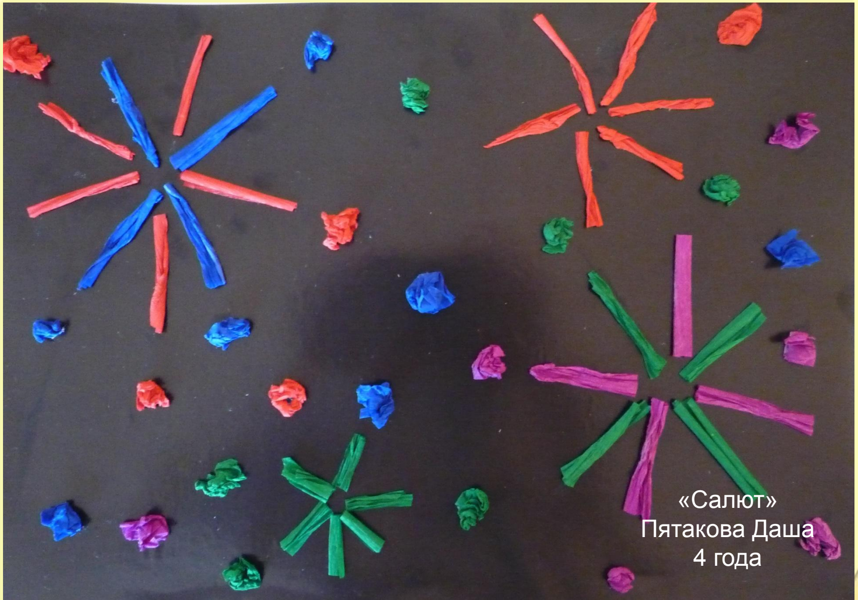
«Салют» Пятакова Даша 4 года