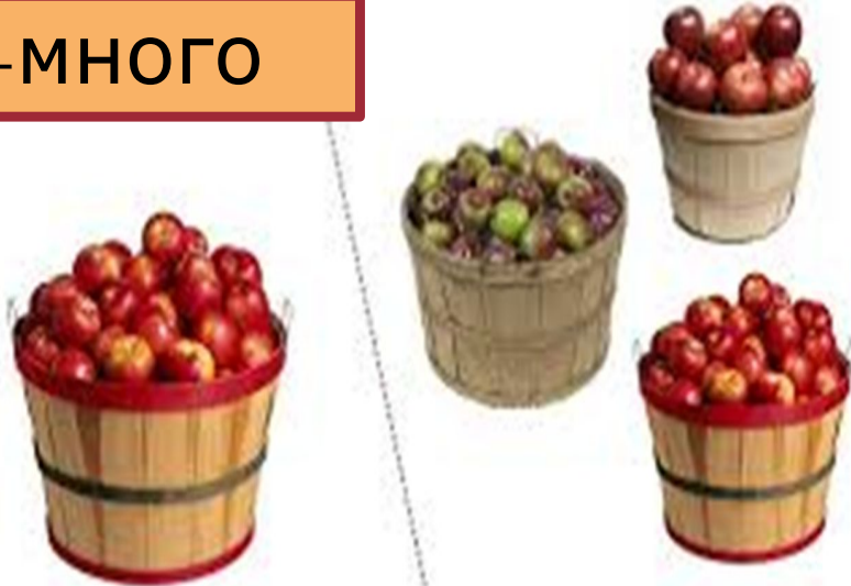
lots (of apples)