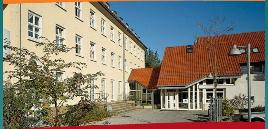
Die Jugendherberge Kassel