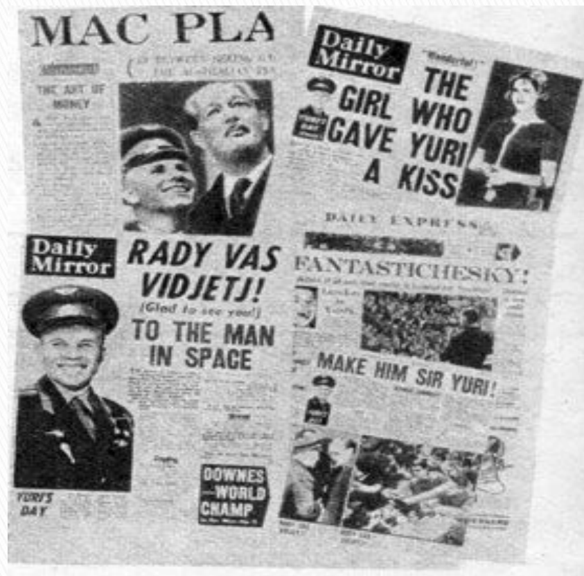
На первой полосе «Дейли мейл» — фотография Ю. Гагарина и премьер-министра Англии Макмиллана.