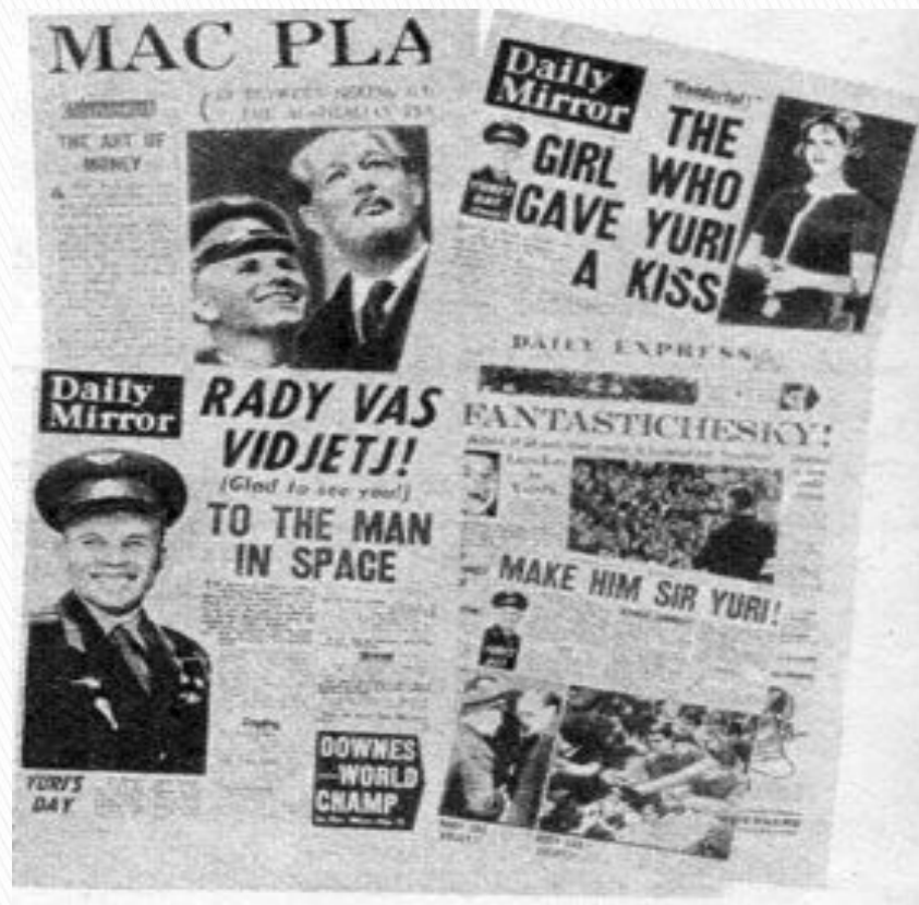
На первой полосе «Дейли мейл» — фотография Ю. Гагарина и премьер-министра Англии Макмиллана.