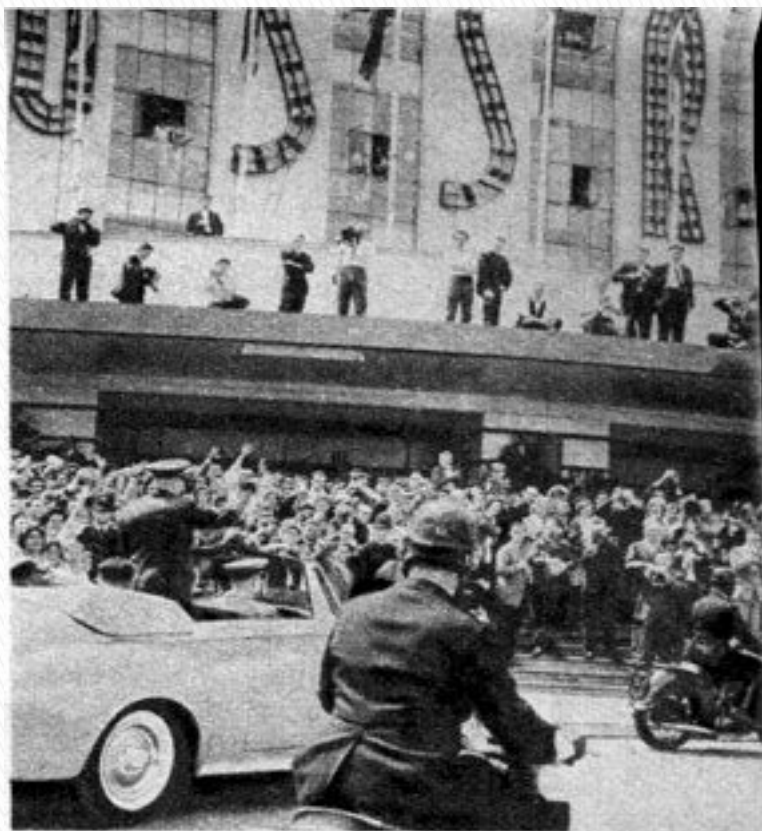
Юрий Гагарин приехал на Советскую выставку в Лондоне.

Для английского народа была возможность продемонстрировать, как сильно он хочет быть другом и жить в мире с народом Советского Союза. Он использовал эту возможность.