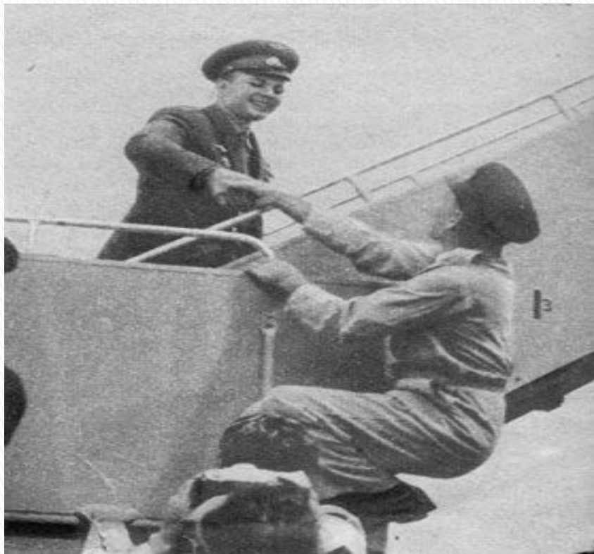
Последнее рукопожатие перед отлетом в Москву.