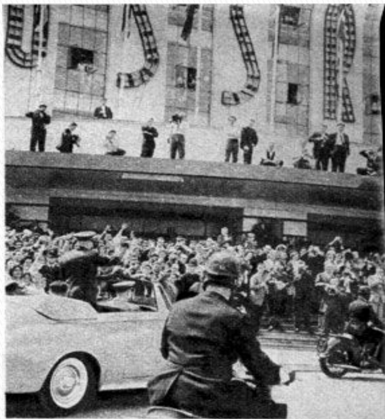
Юрий Гагарин приехал на Советскую выставку в Лондоне.

Для английского народа была возможность продемонстрировать, как сильно он хочет быть другом и жить в мире с народом Советского Союза. Он использовал эту возможность.