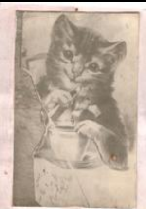
ФАДИ ТАКТАШНЫҢ Ф. КӘРИМ ГА БИРГӘН ОТКРЫТКАСЫ ОТКРЫТКА ПОДАРЕННАЯ Ф. КӘРИМУ ФАДИ ТАКТАШЕМ