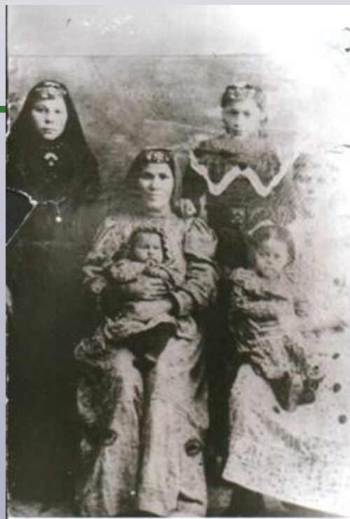
Хатыны һәм балалары