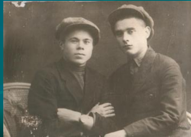
Фатих Кәрим Габрахман Минский белән