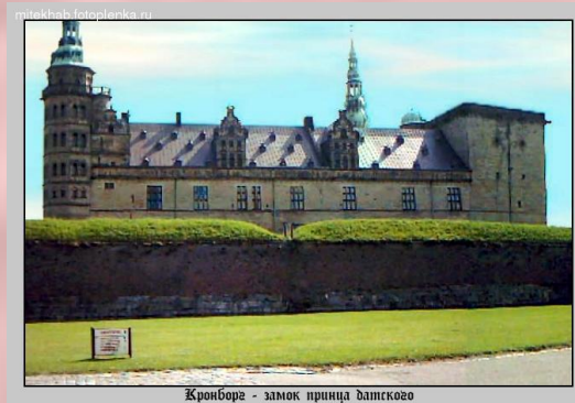
Кронборг - замок принца датского