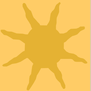
ТАБЛИЦА ДОННЫ ОГЛ