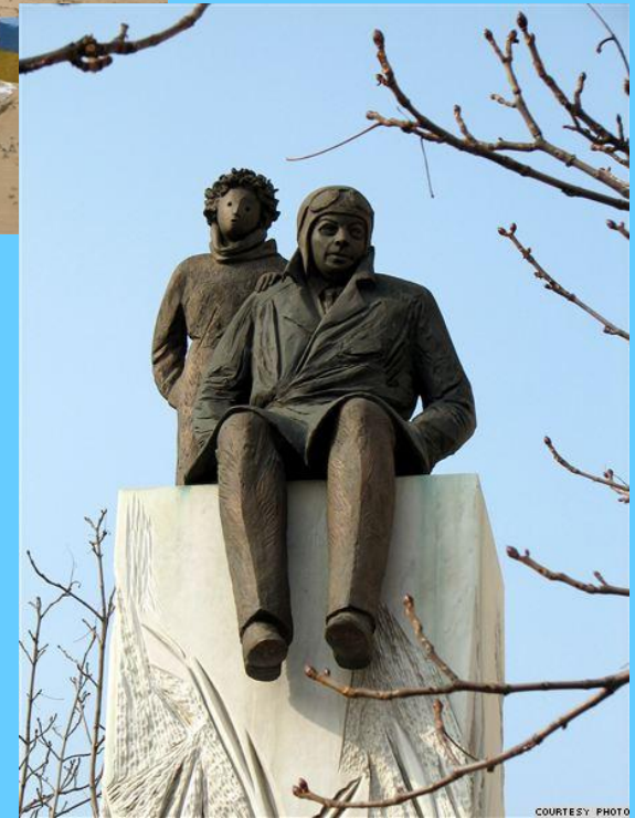
Les monuments de A.S Exupéry