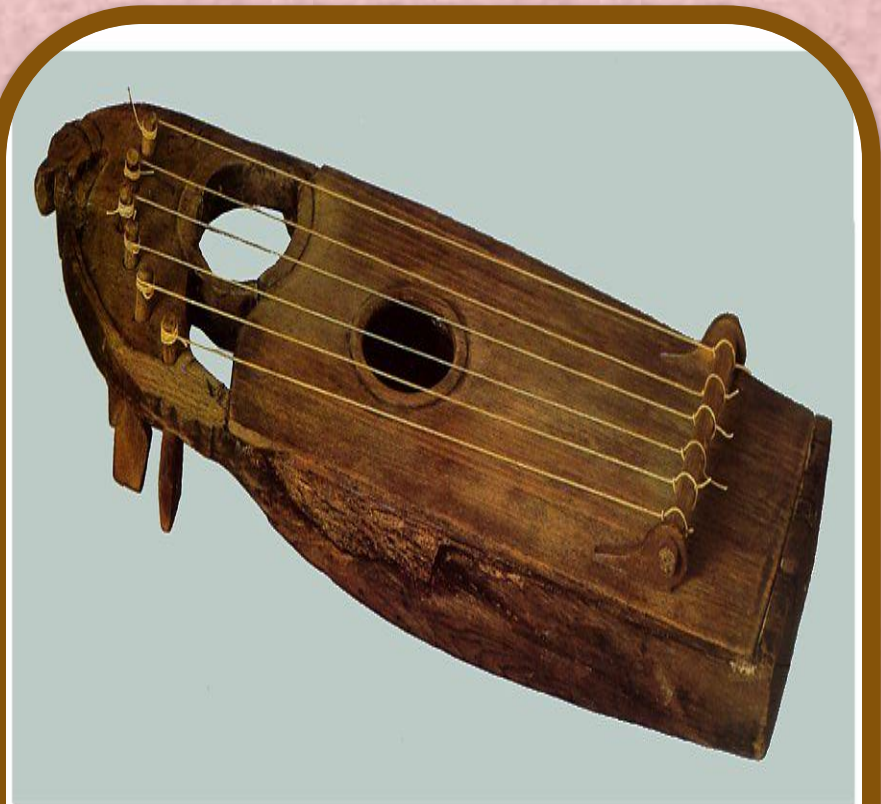
Гусли шестиструнные. Дерево. Длина 35,3 см. Первая половина XII в.

Упоминания о гуслиях часто встречаются в былинах и старинных русских сказках. В XVII веке появились другие, более совершенные гусли с большим количеством струн. Их называли «столовыми» или, точнее, настольными. Это был прямоугольный инструмент, который ставили на стол или просто приделывали к нему ножки. Звук у него был сильнее и звонче. В наше время гусли используются в народных ансамблях.