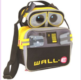
A school bag