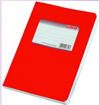
an exercise book