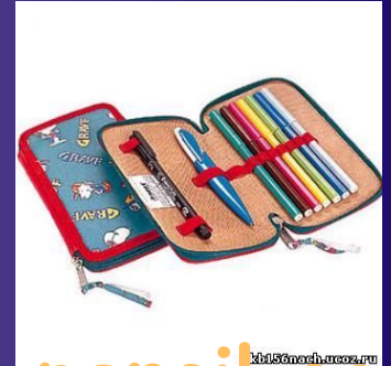
A pencil case