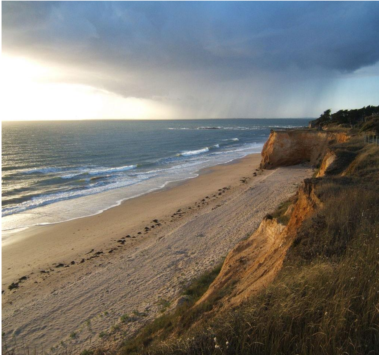
plage de Pénestin