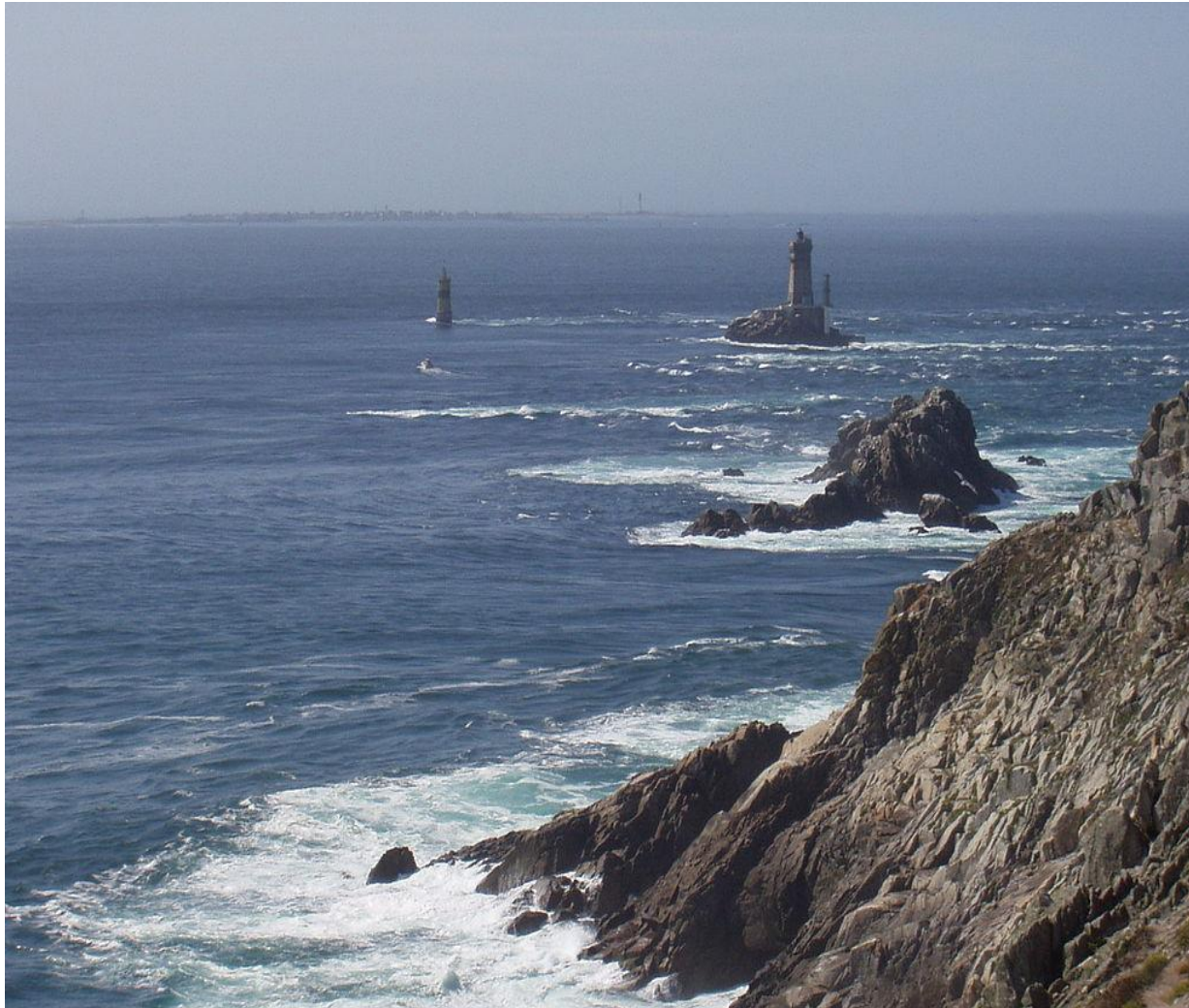
Pointe du Raz (Пуэнт-дю-Ра)