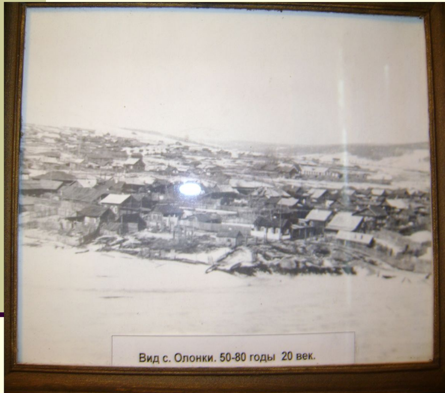
Вид с. Олонки. 50-80 годы 20 век.

Das Dorf Okonki befindet sich 85 Kilometer von Olonki. Nach der Amnestie besuchte W.Rajewskij mit seinem Sohn seine Heimat. Er besuchte die Grabe der Ureltern und Eltern und war in diesem Haus