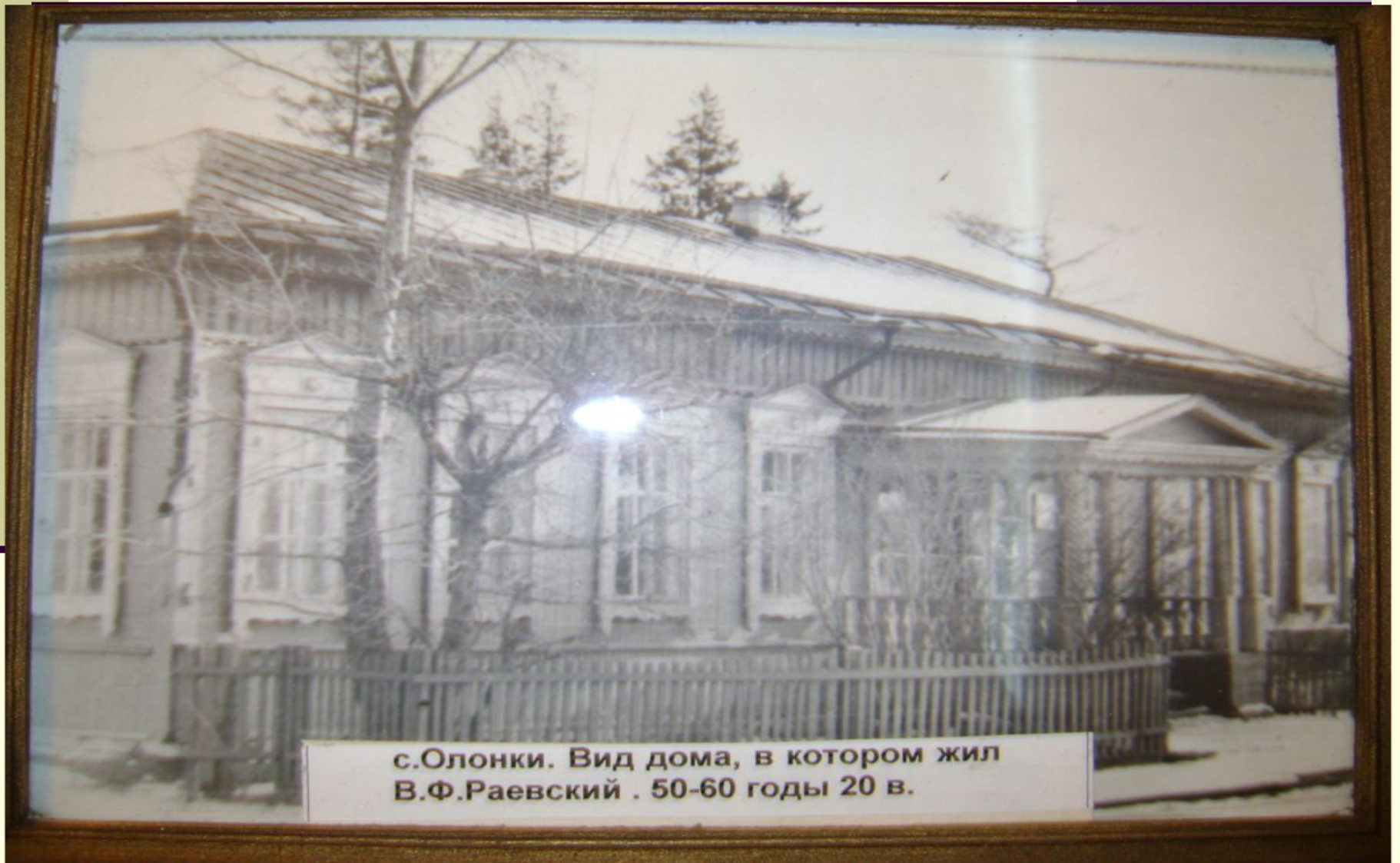
с.Олонки. Вид дома, в котором жил В.Ф.Раевский . 50-60 годы 20 в.

In diesem Haus lebte W.Rajewsky in Olonki.