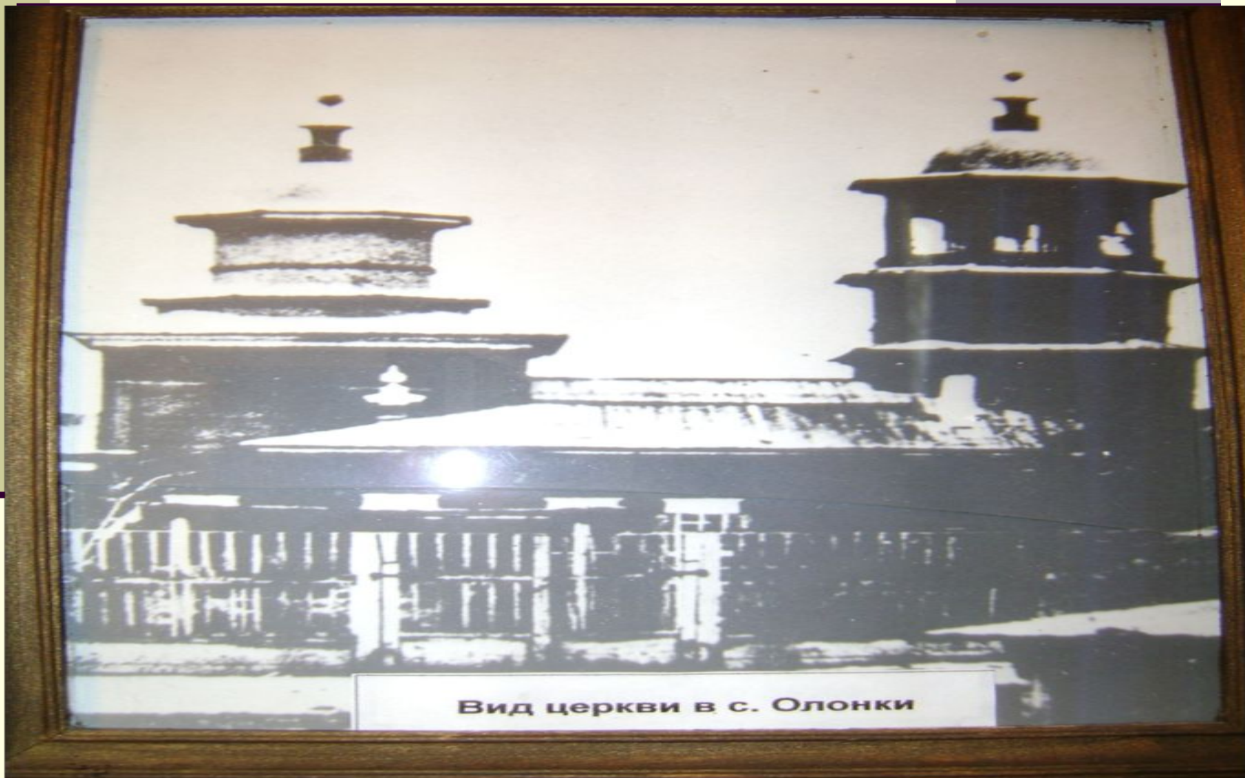
Вид церкви в с. Олонки