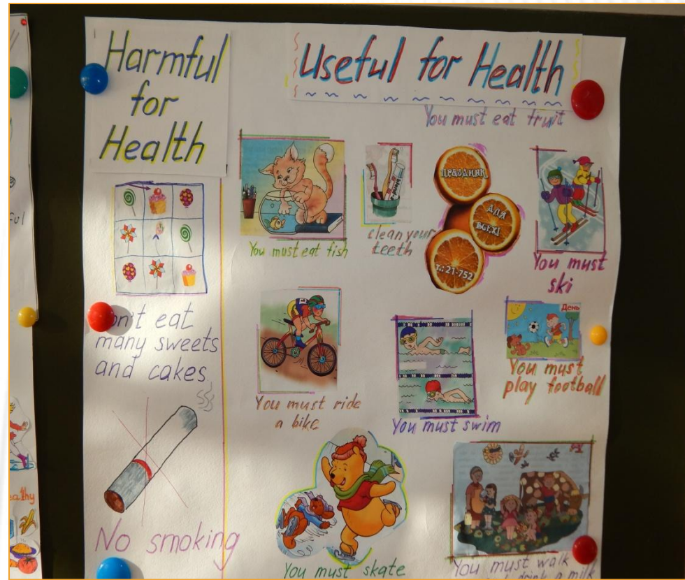
КОЛЛЕКТИВНЫЙ МИНИ-ПРОЕКТ «Здоровый образ жизни», 3 класс