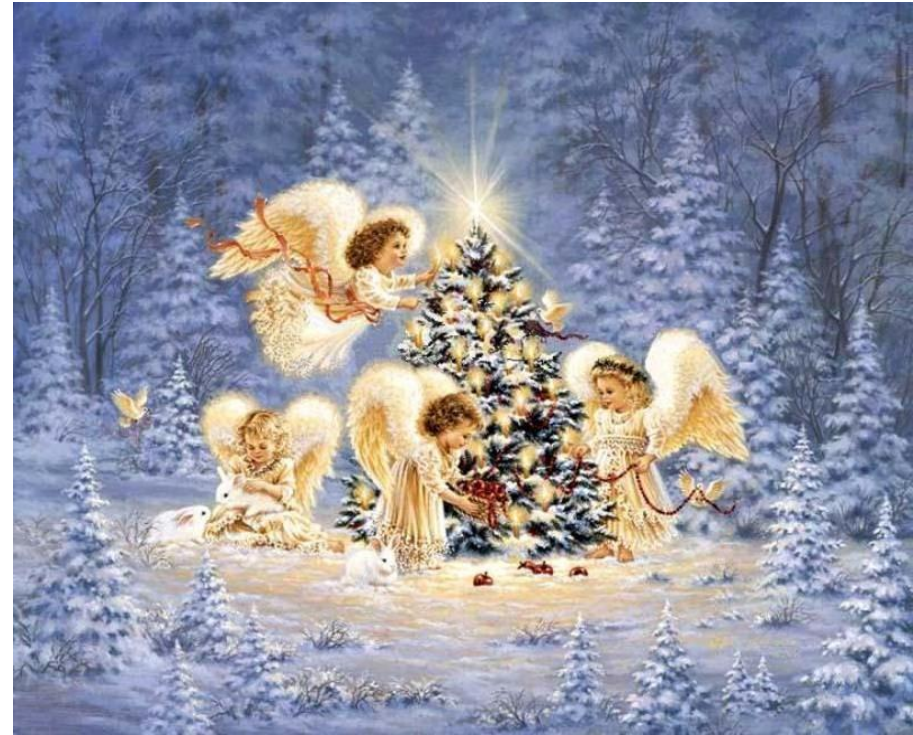
Соня Хубова, 4 Г