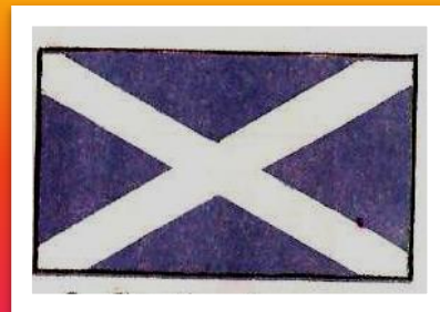
The flag of Scotland.