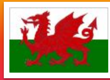
The flag of Wales