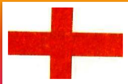
The flag of England.