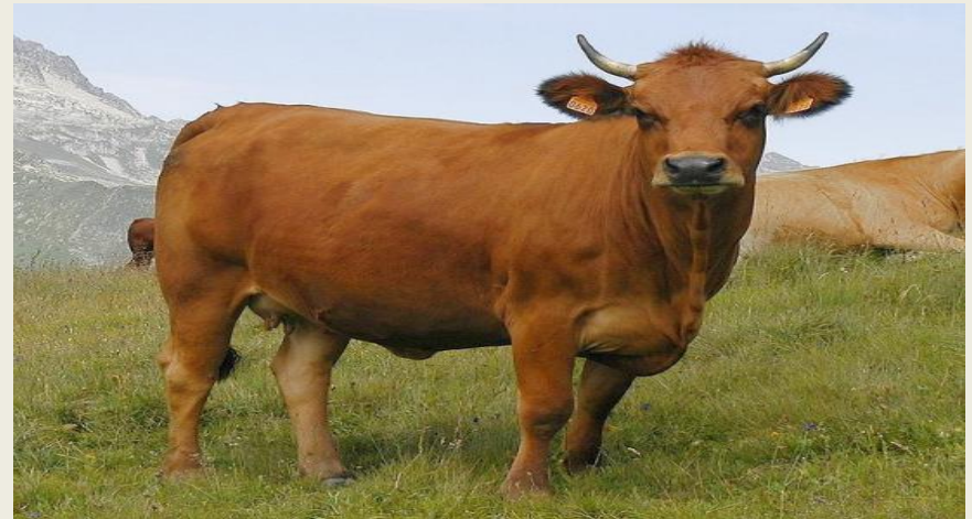
la tarine, une des vaches françaises, une bonne marcheuse grâce à sa petite taille et à son ossature légère.