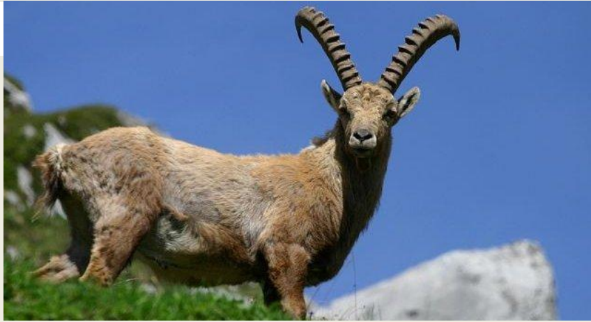
Le bouquetin(горный баран) c'est un animal aux longues cornes recourbées