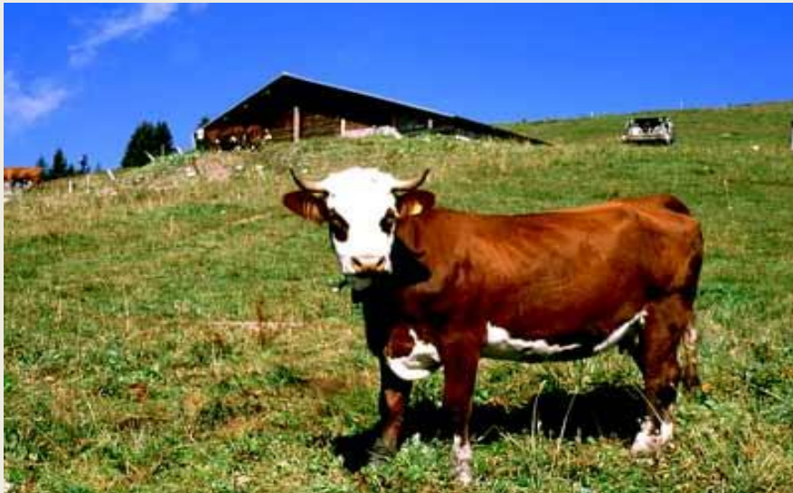
L'abondance(бык) c'est le taurin L'abondance(бык) c'est le taurin(бык) originaire de France (Savoie)