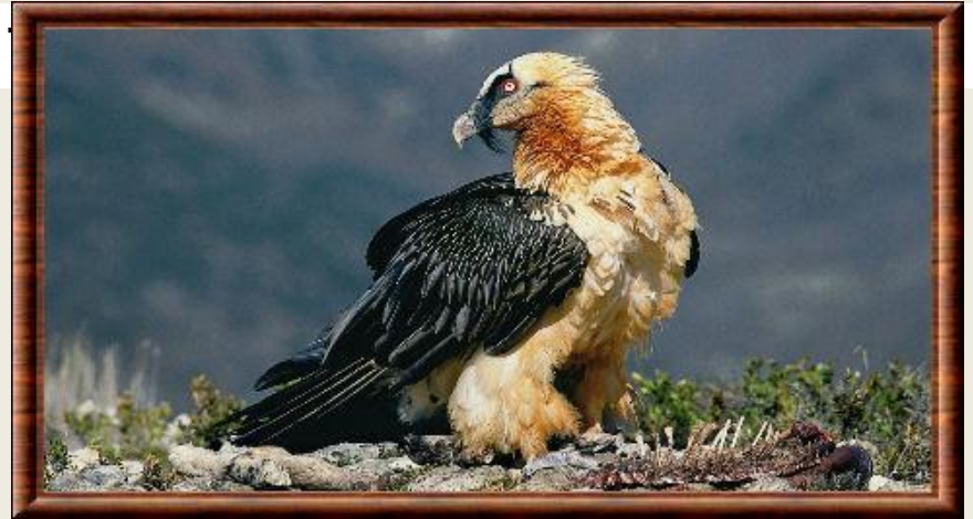
Le Gypaète barbu(бородач) est le plus grand vautours(гриф) présenté en France.