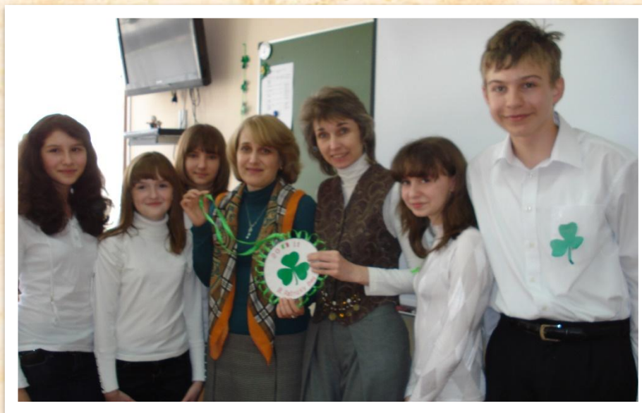
День Святого Патрика в МОУ Гимназия №11