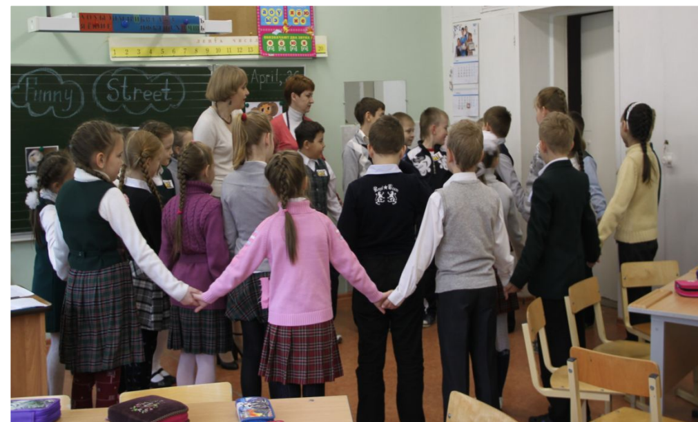
Открытый урок «Funny Street»