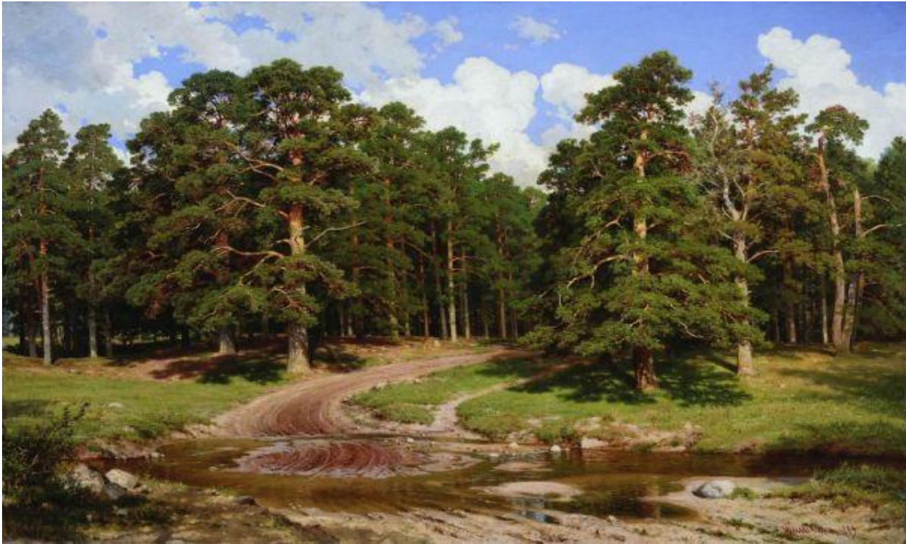
« Pine wood » , 1895.