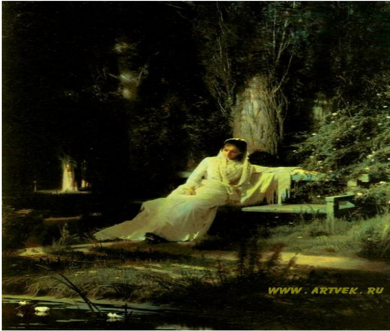
«Moonlit Night», 1884.