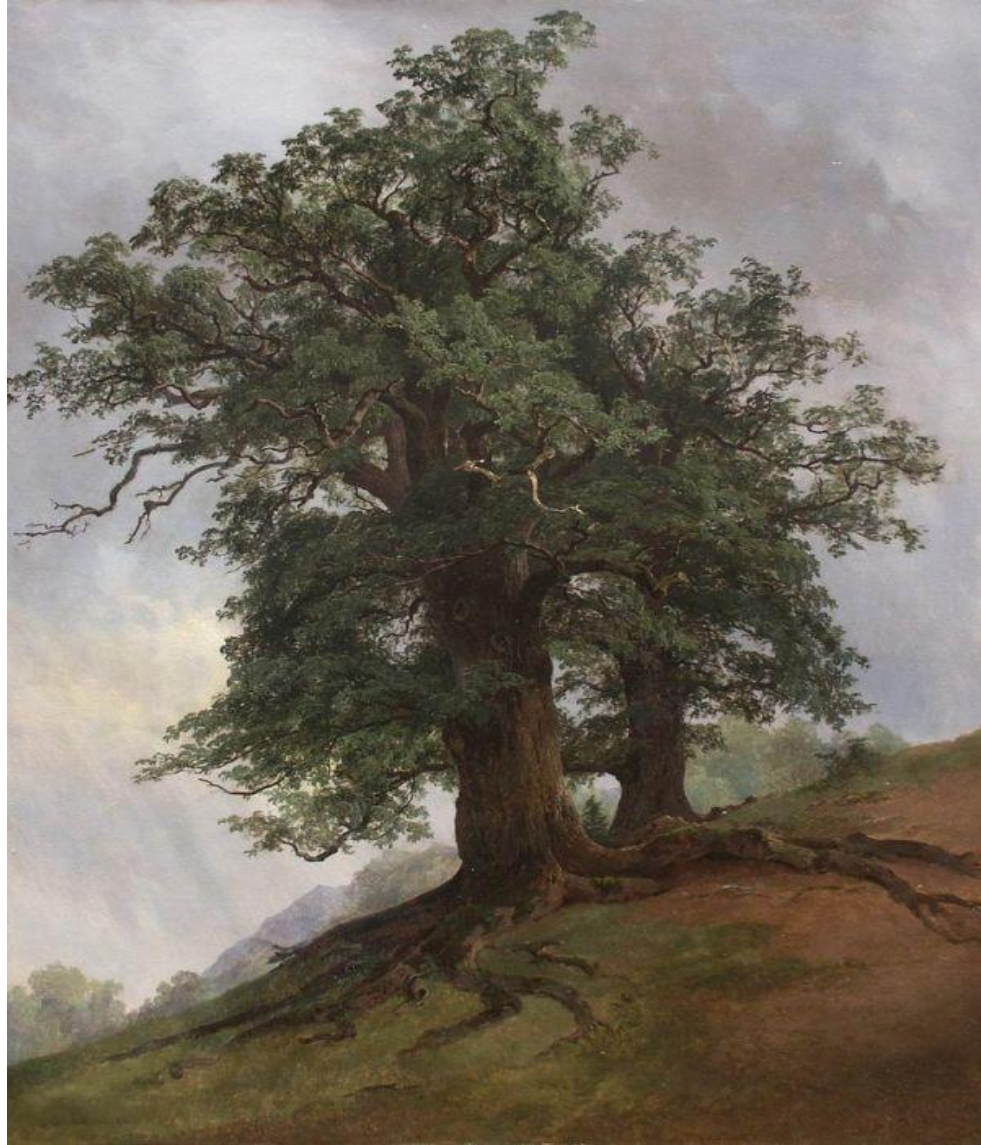
«Old Oak » , 1866.