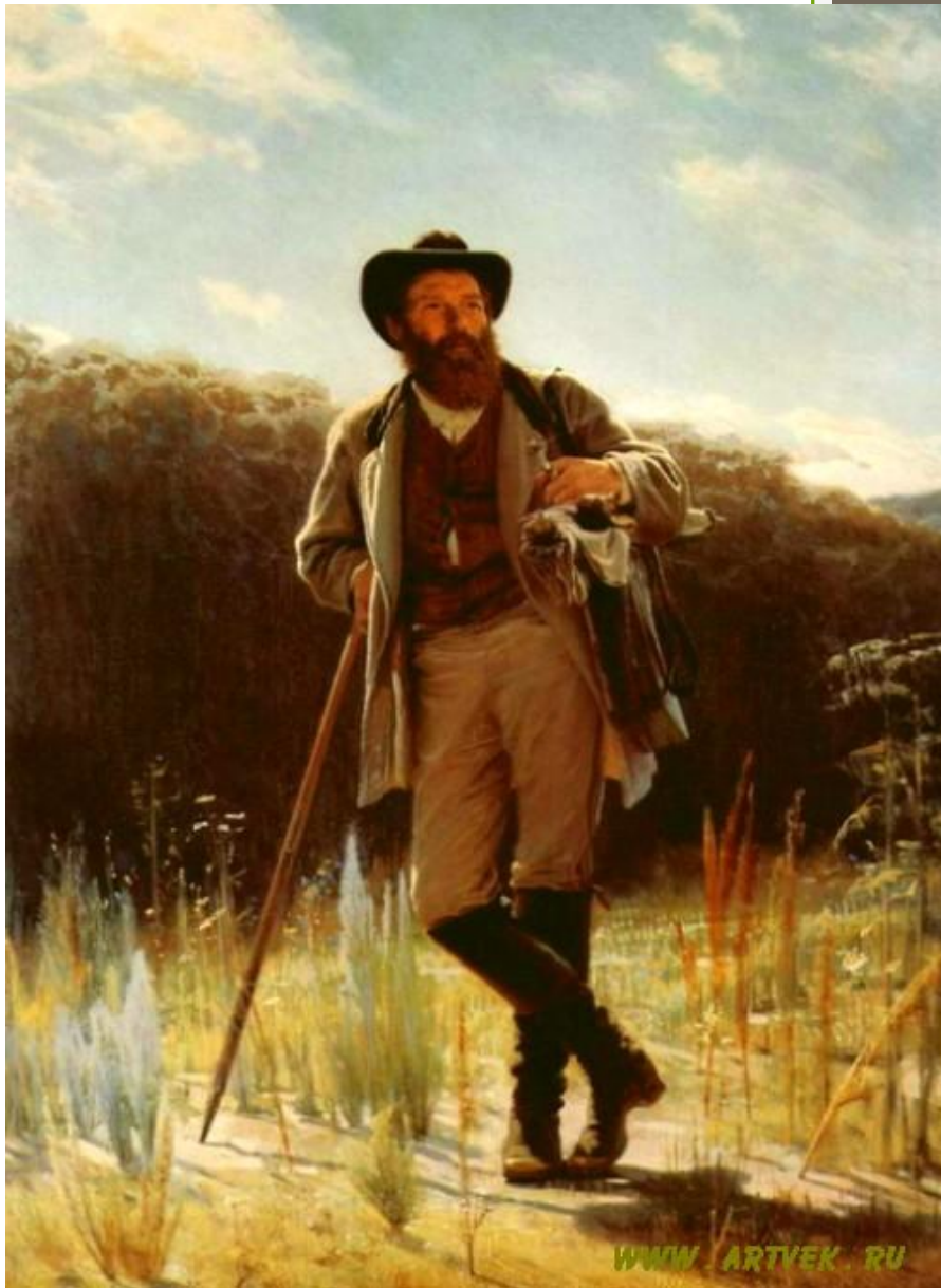
«I. Shishkin» , 1884.