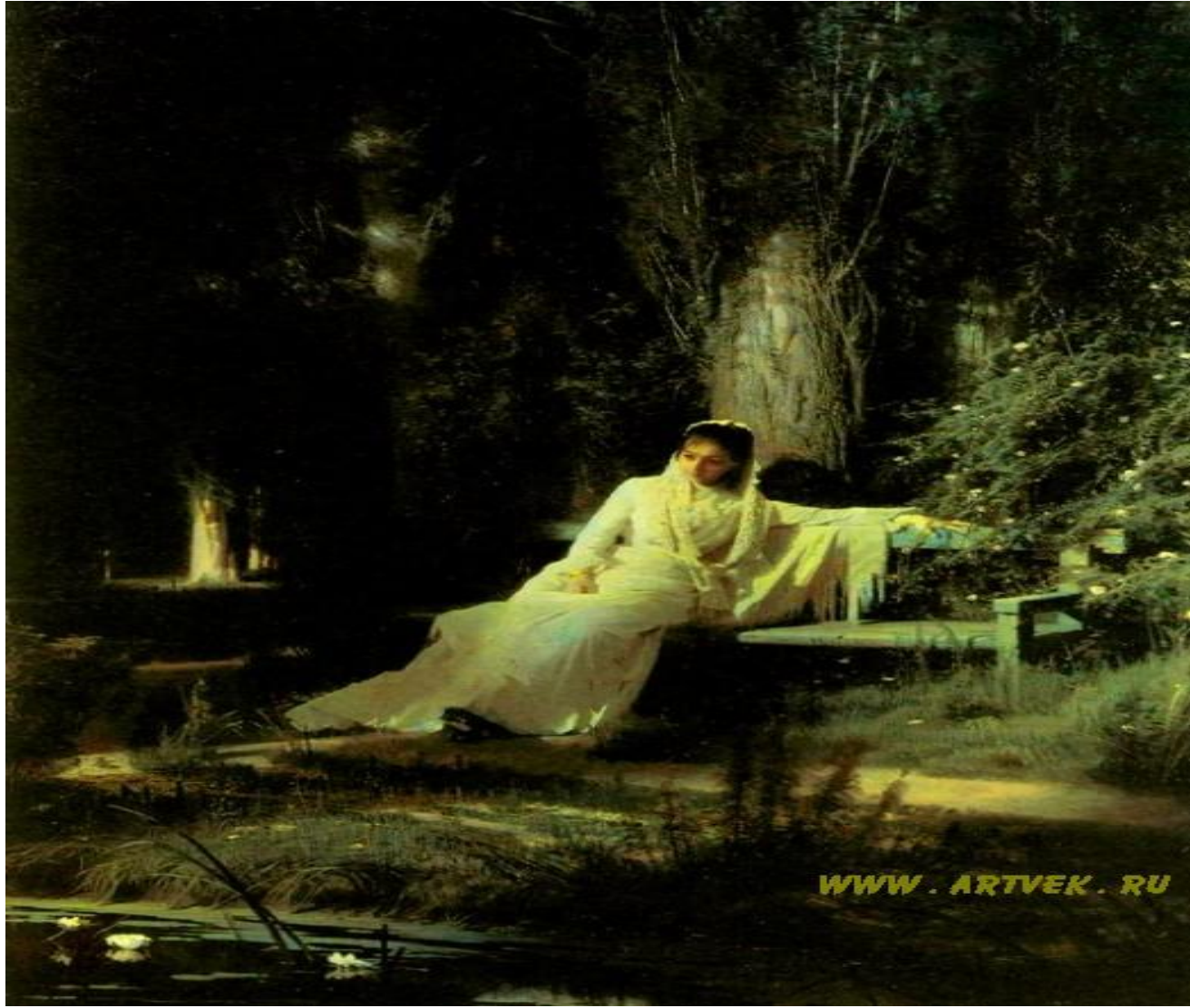
«Moonlit Night», 1884.