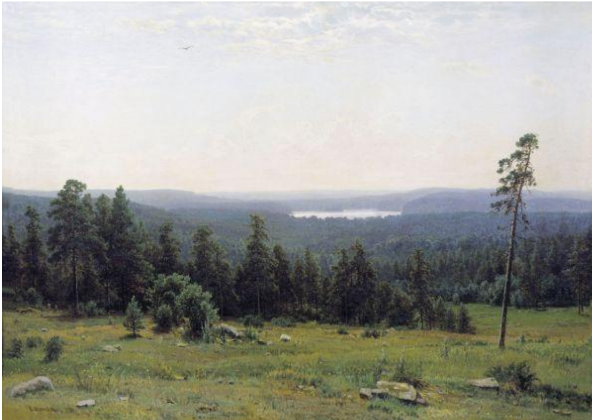
« Far Away Woods» , 1884.