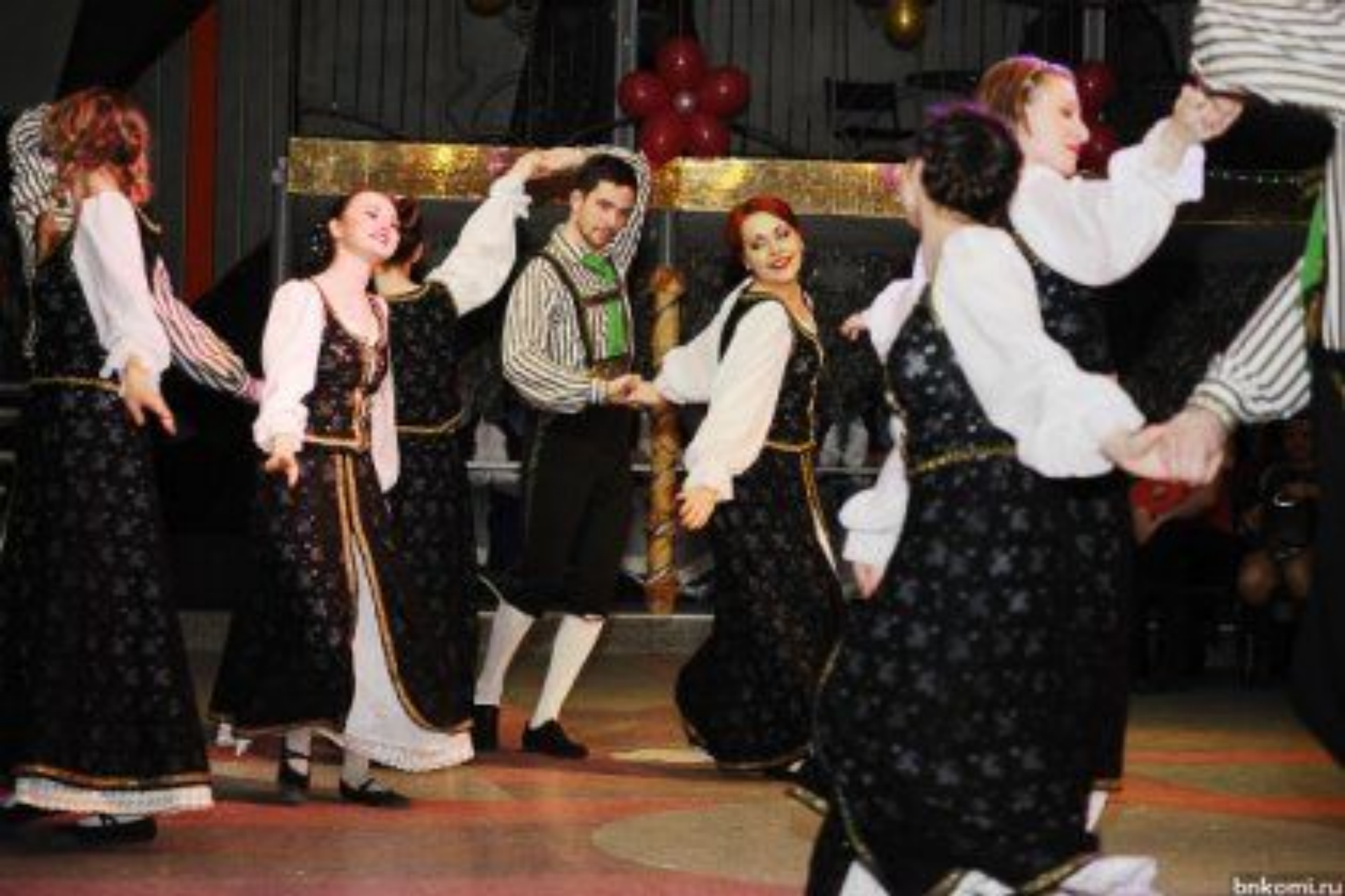
Der Tanz Lendler