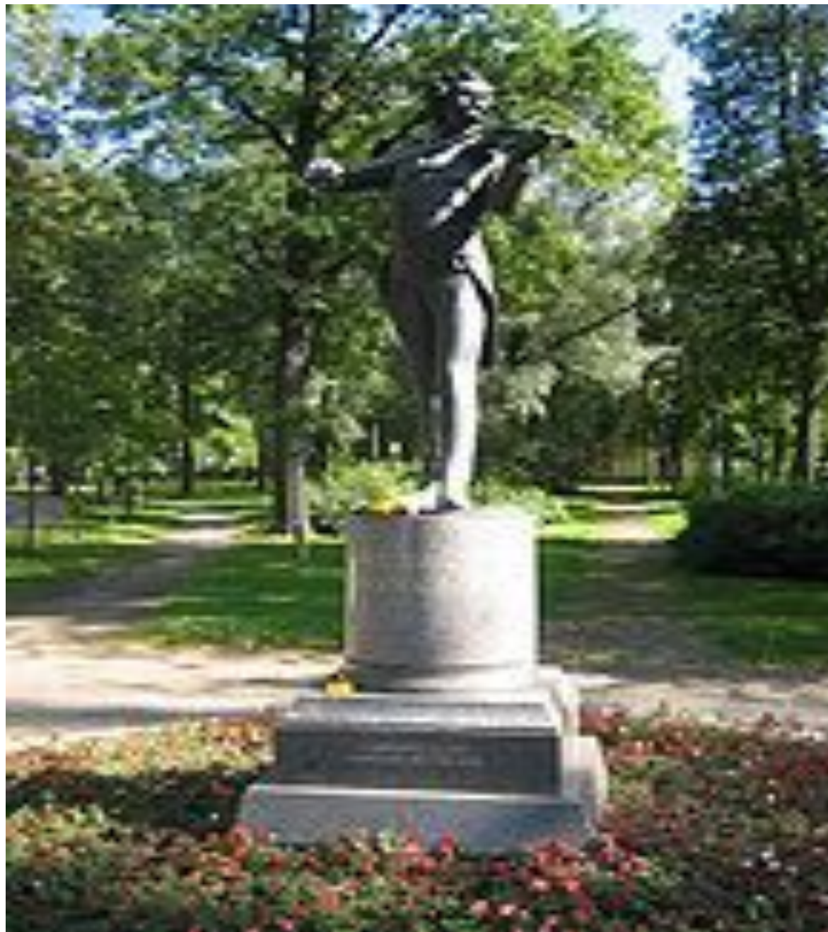
Памятник Штраусу в Дрездене