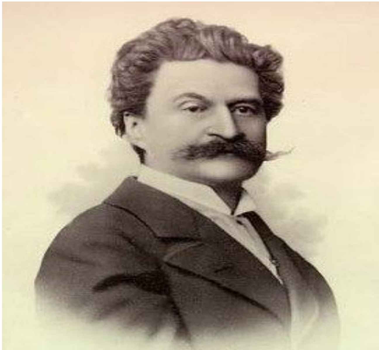
Johann Strauß -Vater