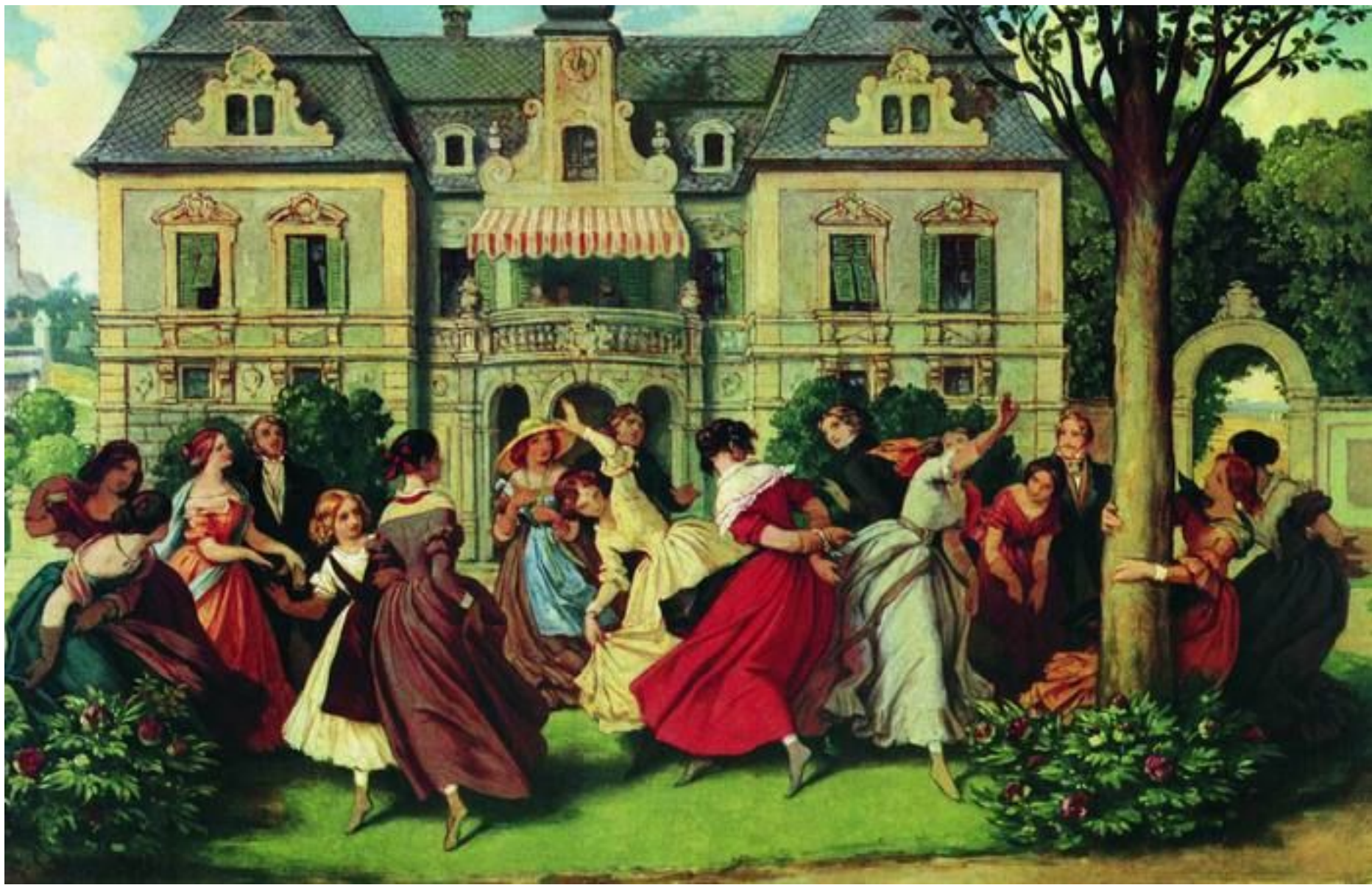
Народный австрийский танец лендлер, предшественник вальса Österreichischer Volkstanz Ländler, Vorläufer des Walzers