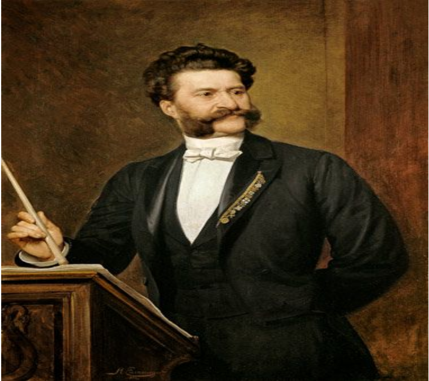
Johann Strauss - Vater