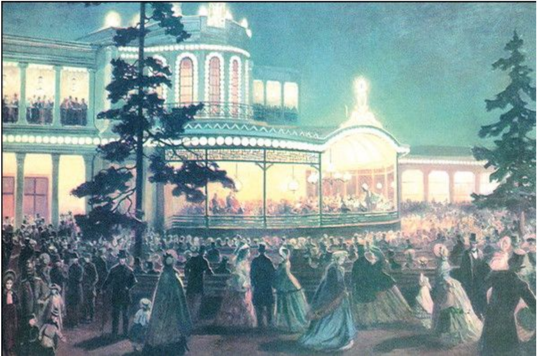
Das prächtige Gebäude des Pawlowbahnhofs