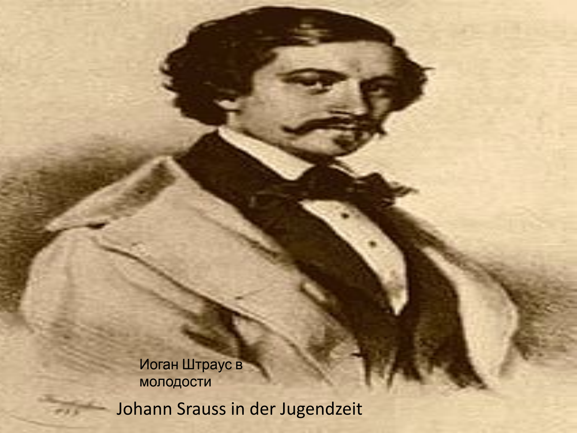
Иоган Штраус в молодости