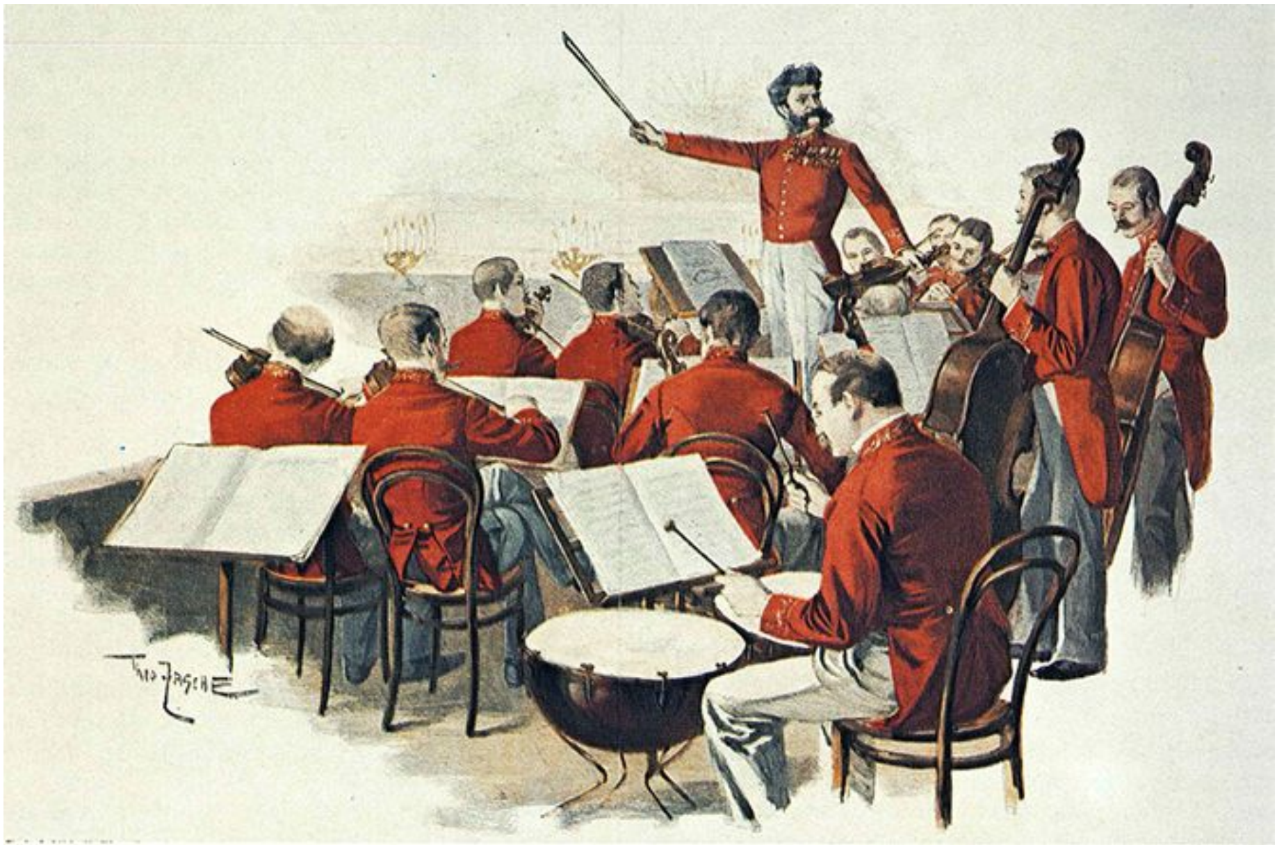
Der Walzerkönig – Johann Strauss - Sohn