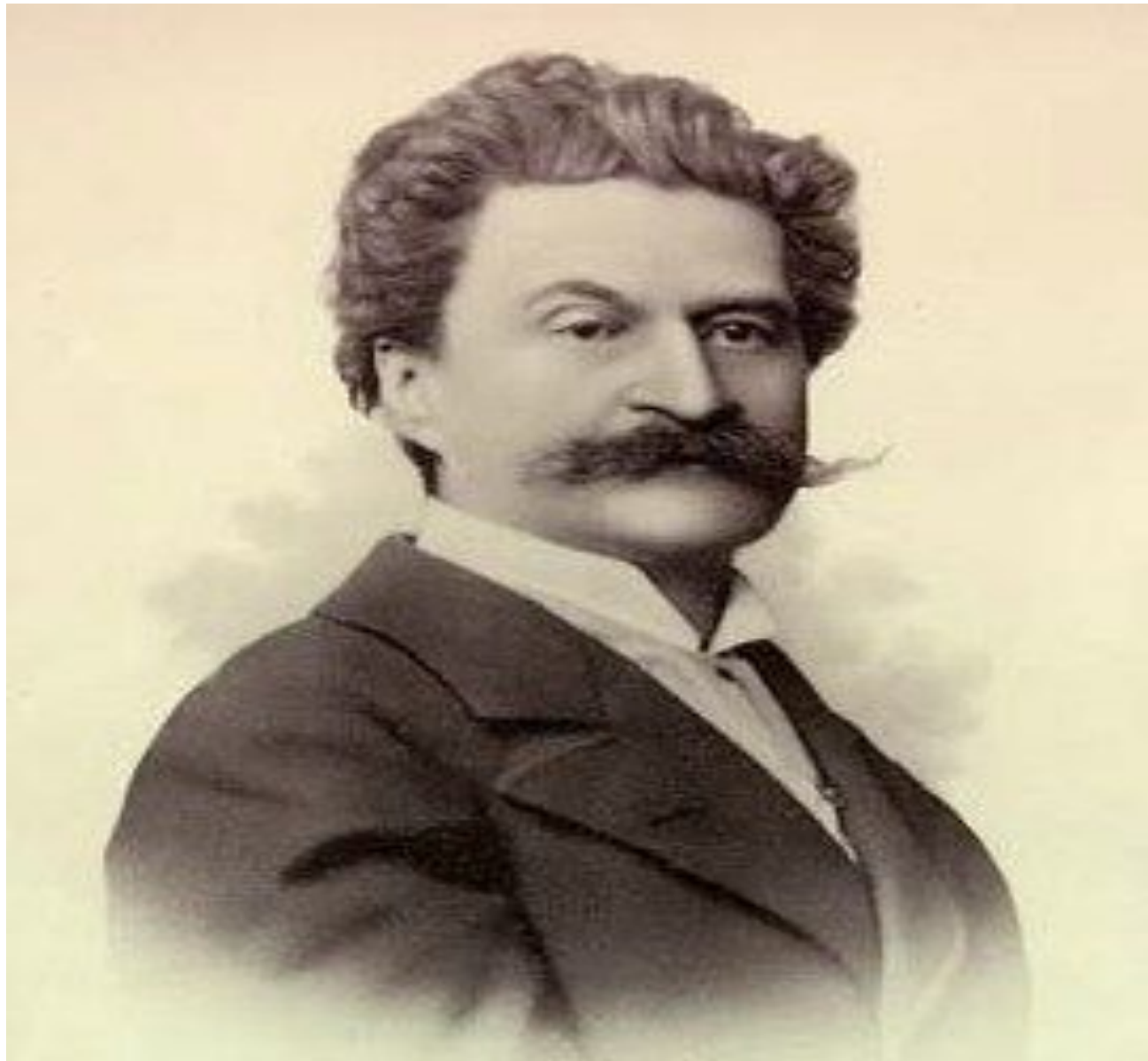
Johann Strauß -Vater