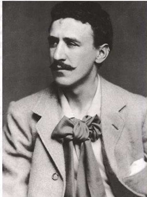
Чарльз Ренни Макинтош (1868 – 1928)

Шотландский архитектор, художник и дизайнер, родоначальник стиля модерн в Шотландии.