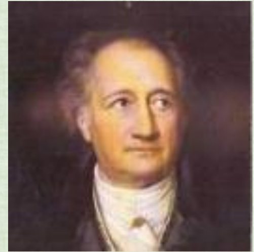
Johann Wolfgang von Goethe

Große deutsche Dichter und Schriftsteller