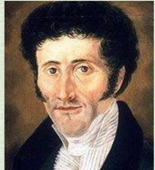
Ernst Theodor Amadeus Hoffmann