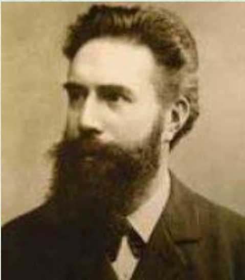
Wilhelm Conrad Röntgen