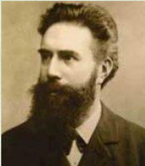
Wilhelm Conrad Röntgen