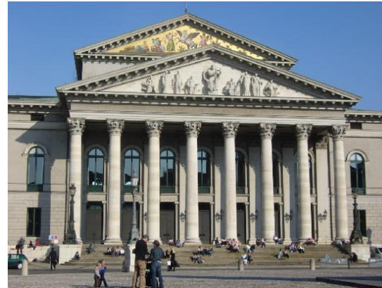
die Bayerische Staatsoper