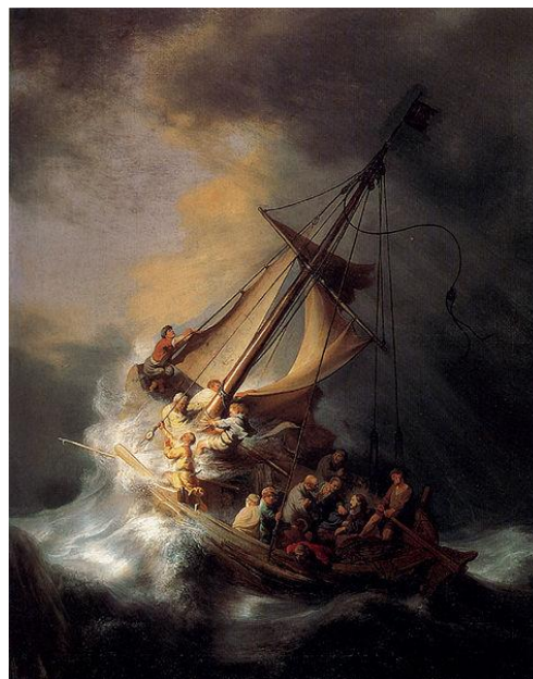
«Христос во время шторма на море Галилейском»