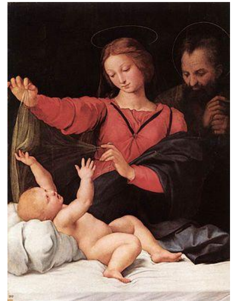
Мадонна с вуалью