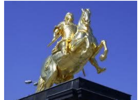
der Golden Reiter