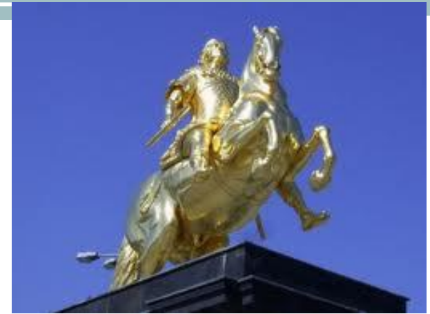
der Golden Reiter