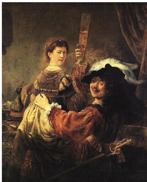
«Блудный сын в таверне»