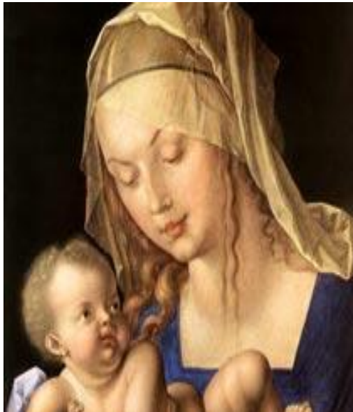
Мадонна с грушей