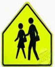
School crossing Pentagon