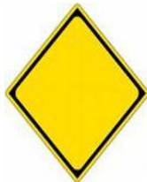
All others Diamond