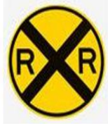
Railroad crossing Round