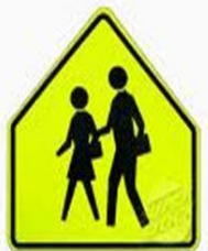
School crossing Pentagon