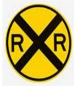
Railroad crossing Round