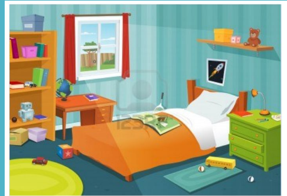
bed, window, shelf, toys, books, carpets, poster, box, bedside-table