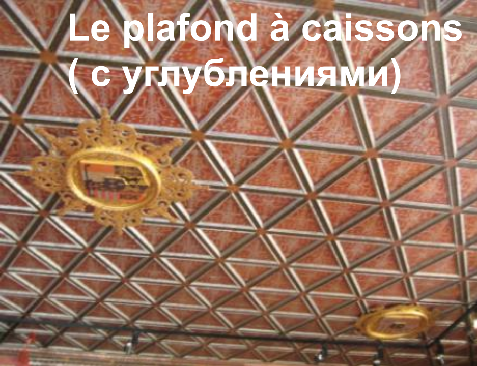
Le plafond à caissons ( с углублениями)