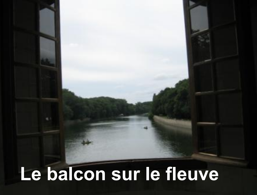
Le balcon sur le fleuve