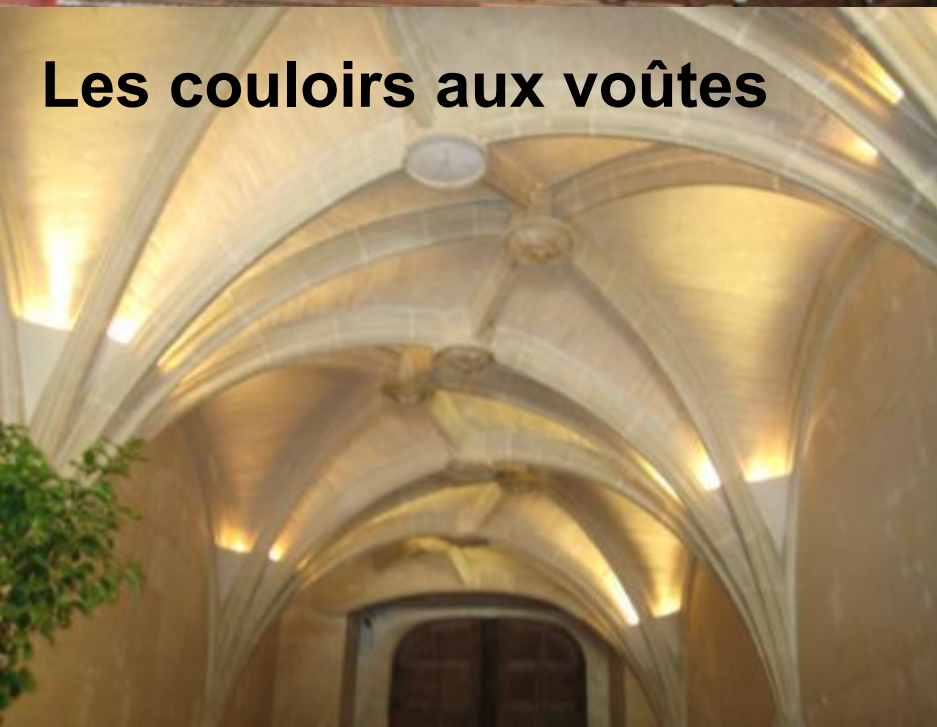
Les couloirs aux voûtes