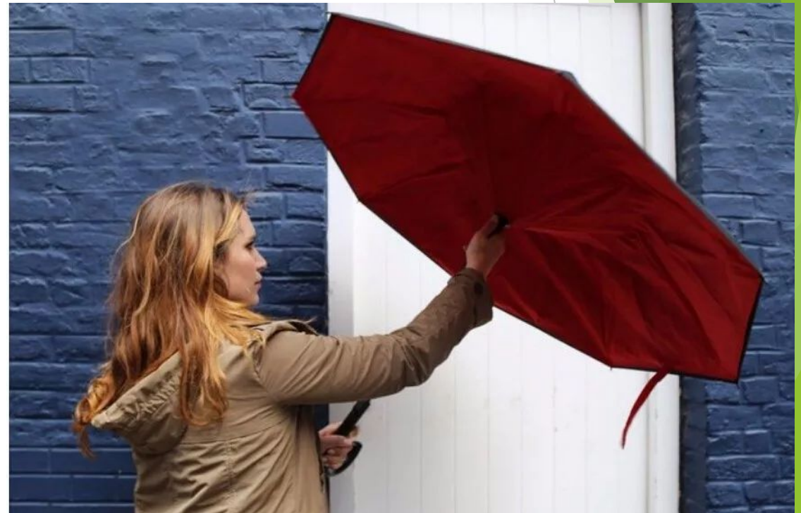
Открыть зонтик в помещении.