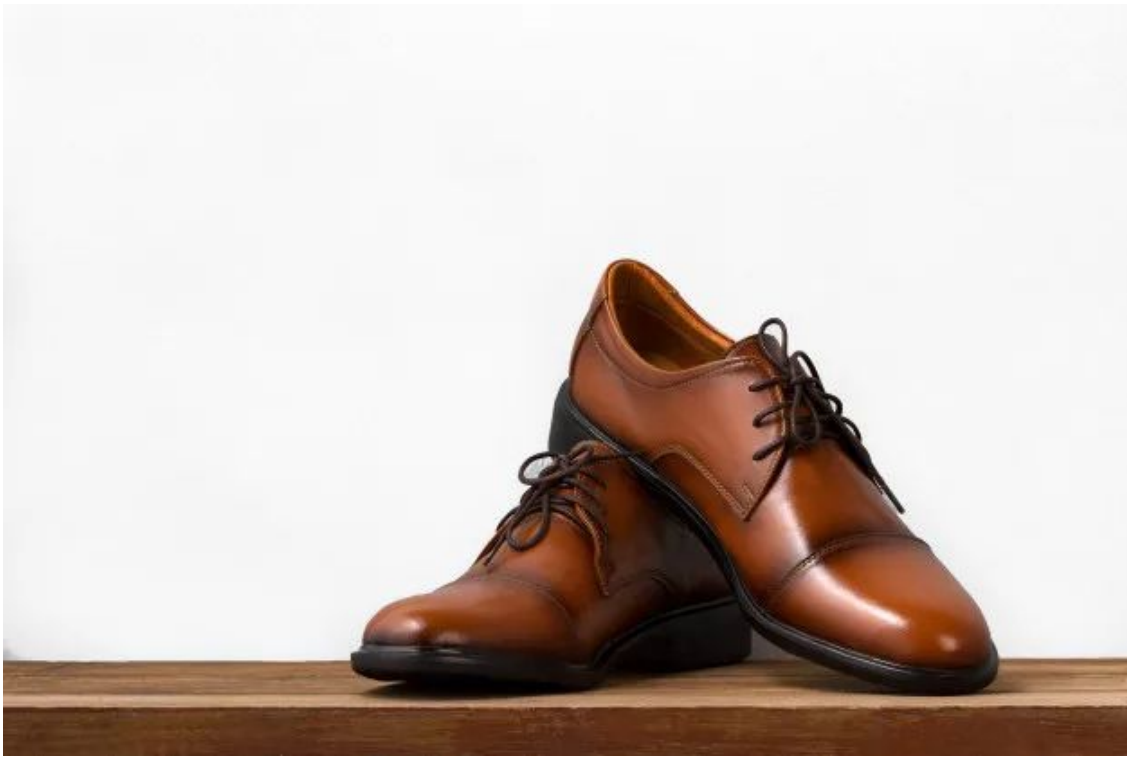
Новые ботинки на столе.