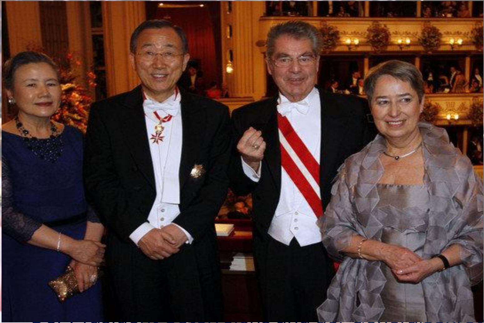
Bei der UNO Ban Ki-Moon sind bei dem Wiener Ball anwesend