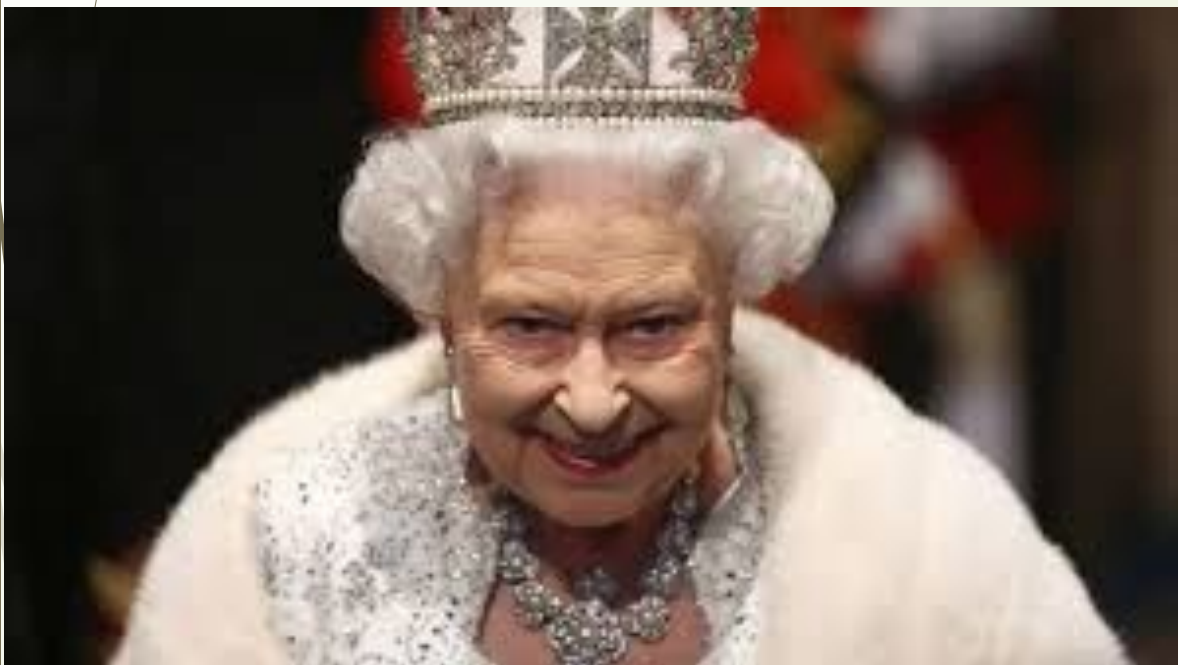
Ее величество- Елизавета II

Это одно из немногих мест на планете, где до сих пор можно встретить королеву.