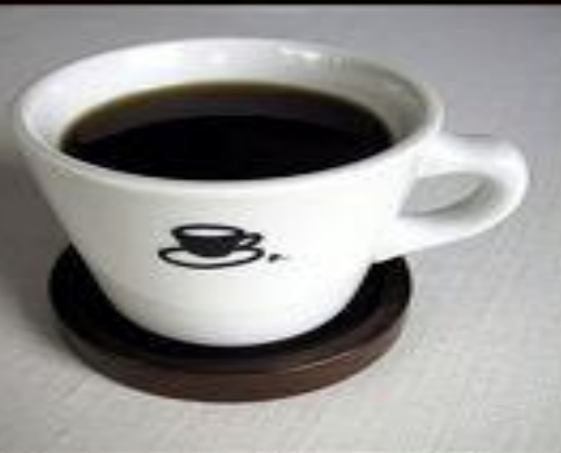
Крепкий кофе strong coffee

сваренный кофе-brewed coffee растворимый кофе-instant coffee