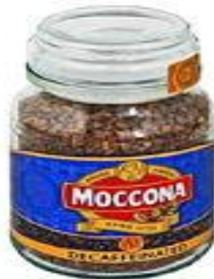
кофе без кофеина decaffeinated разг. unleaded