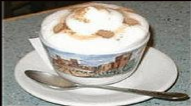
кофе-гляссе iced coffee