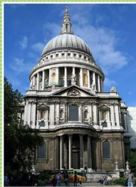
St. Paul's Cathedral

В день Рождества во всех церквях звучат рождественские гимны, а самые величественные службы проходят в Вестминстерском кафедральном соборе, соборе Святого Павла, Вестминстерском аббатстве.