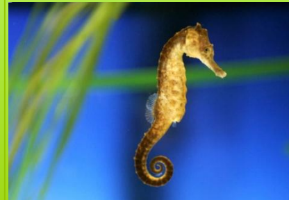
S e a h o r s e