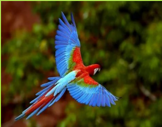
P a r r o t