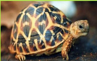
T o r t o i s e