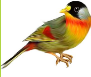
B i r d