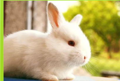
R a b b i t