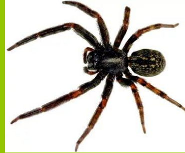
S p i d e r