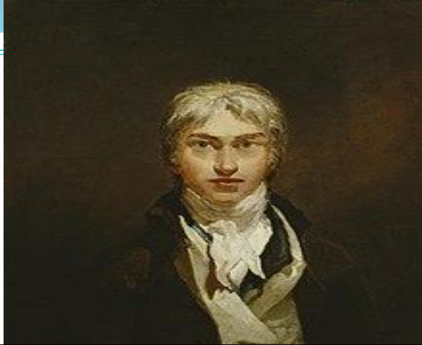
Joseph Mallord William Turner