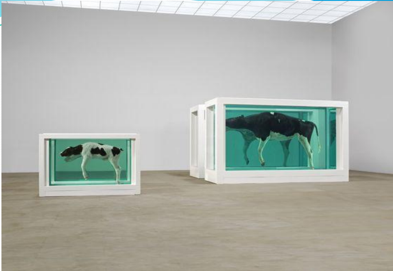
Mother and Child, Divided