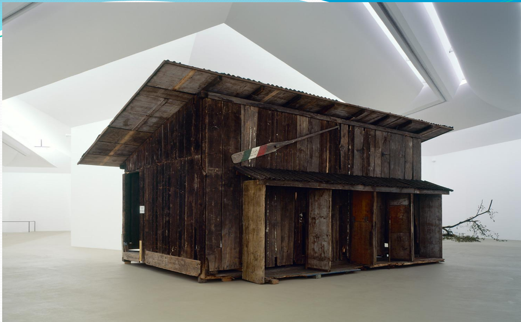
SIMON STARLING “SHEDBOATSHED”