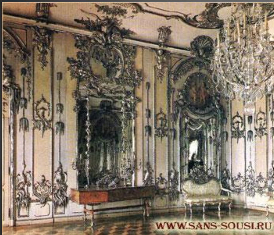
Верхняя концертная комната