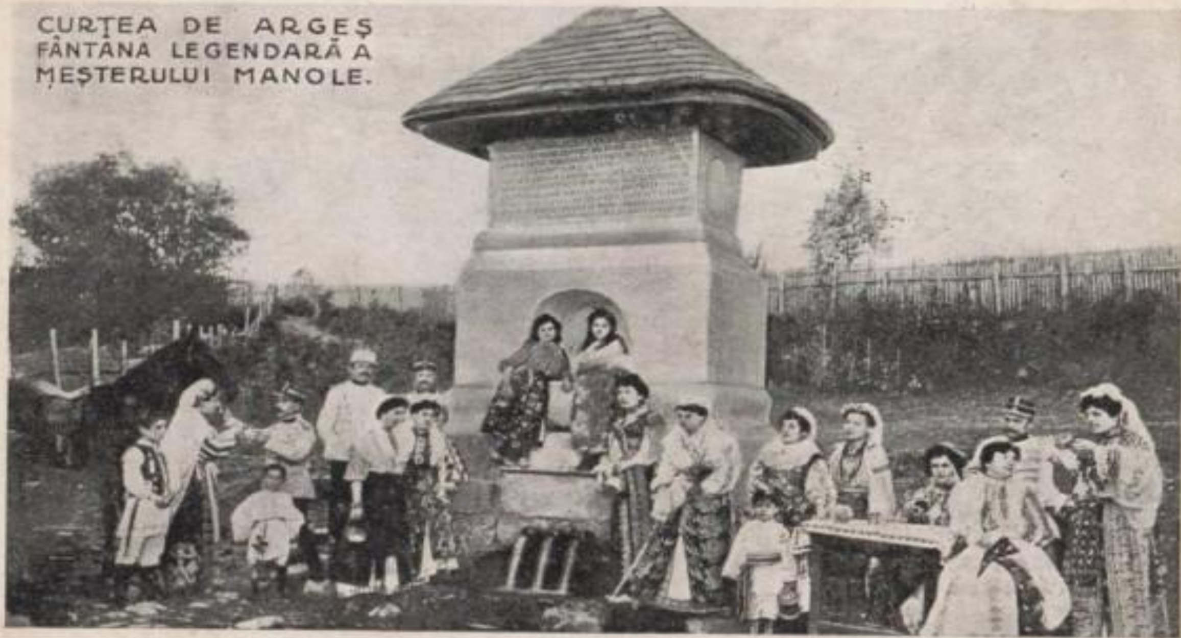
CURȚEA DE ARGHEȘ FÂNTANA LEGENDARĂ A MEȘTERULUI MANOLE.