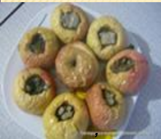
Die Bratäpfel im Backofen