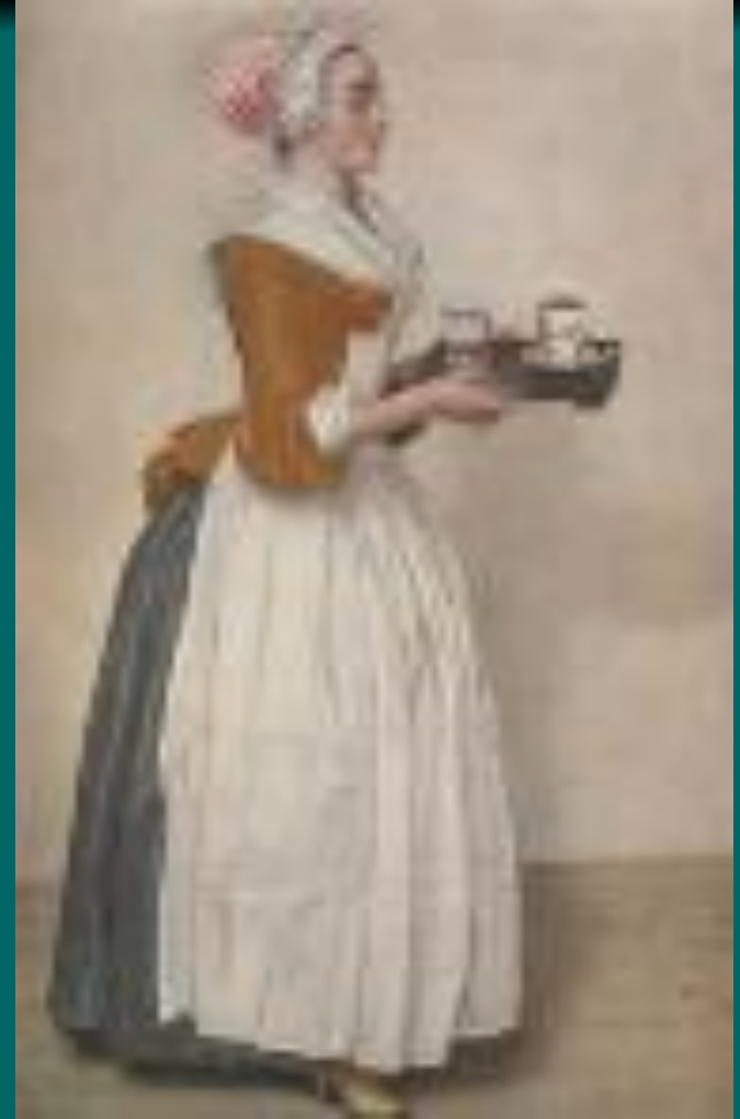
Жан-Этьенн Лиотар - Шоколадница