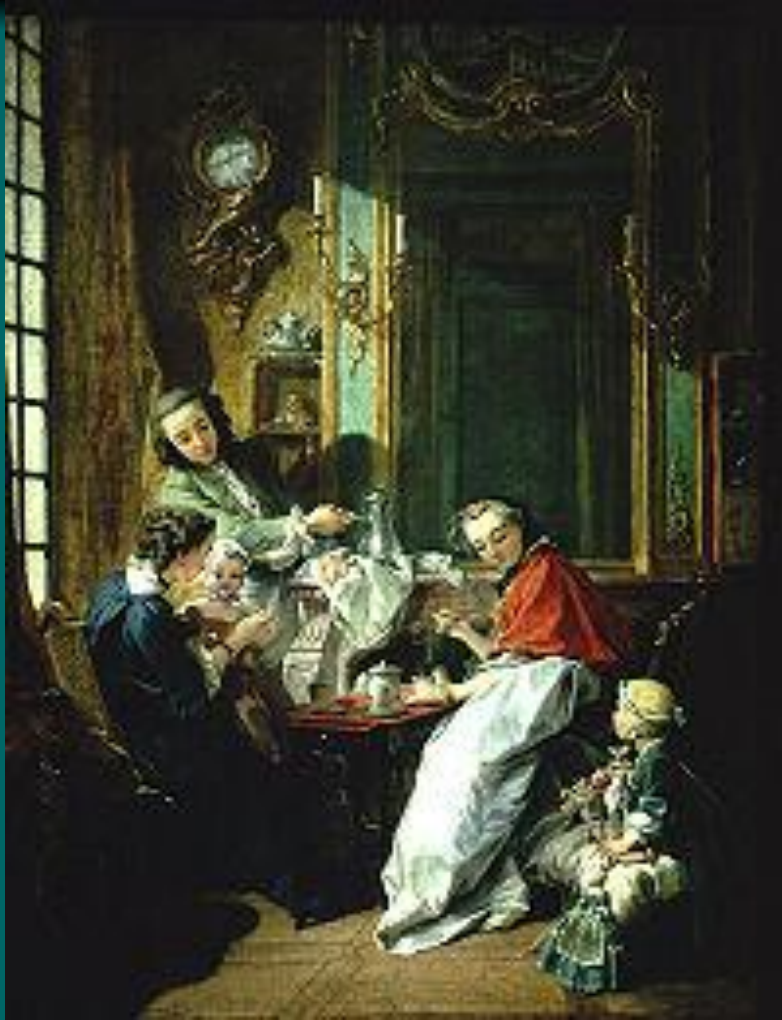
Франсуа Буше Завтрак

Свежий чай подобен бальзаму. Чай, простоявший ночь, подобен змее