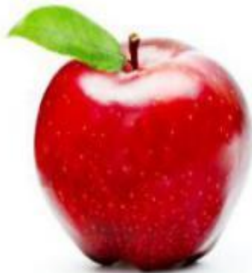
a n a pple

A pples here, a pples there, A pples, a pples everywhere!